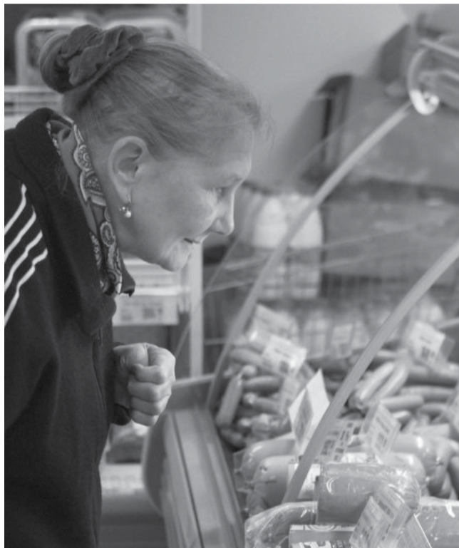
Прилавки пока не пустуют, но цены уже кусаются

А вот рыба (свежемороженая горбуша) не столь стремительно растет в цене: со 167 руб. до 180 руб. (в