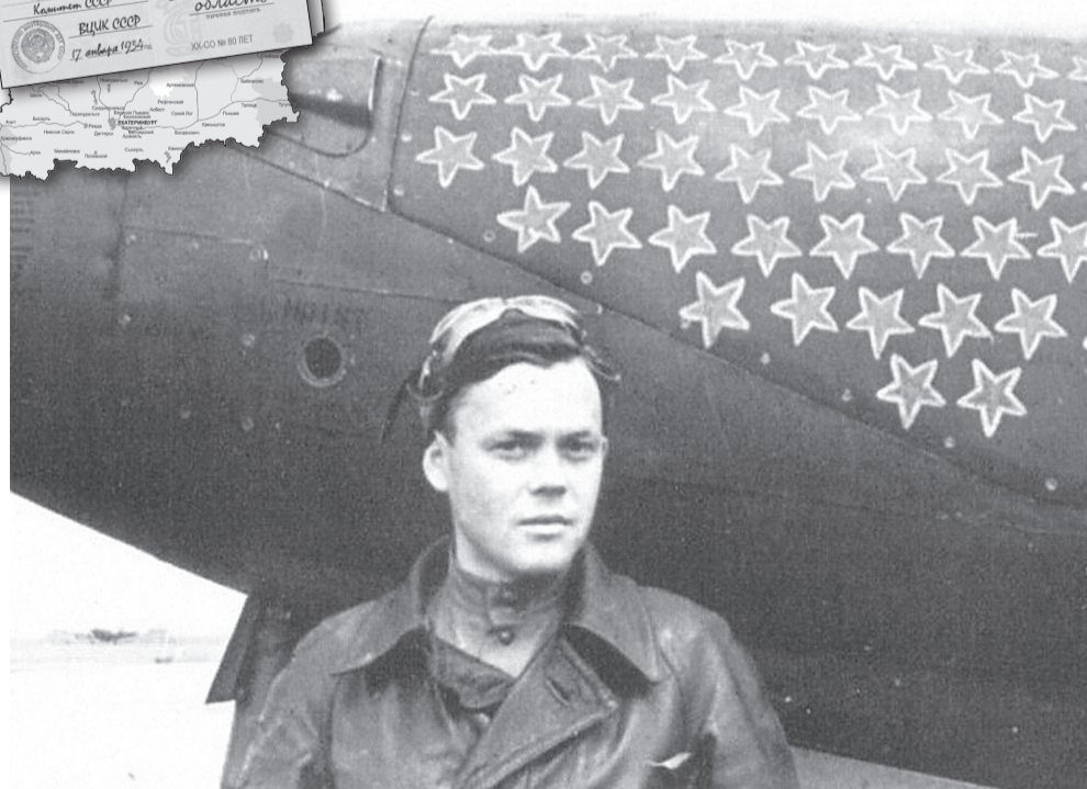
Рекорд уральца Г.А.Речкалова на американском истребителе Bell P-39 Airacobra в годы Великой Отечественной войны так никто и не побил. Воздушный ас совершил 450 боевых вылетов, провёл 122 воздушных боя, сбил 61 самолёт противника.