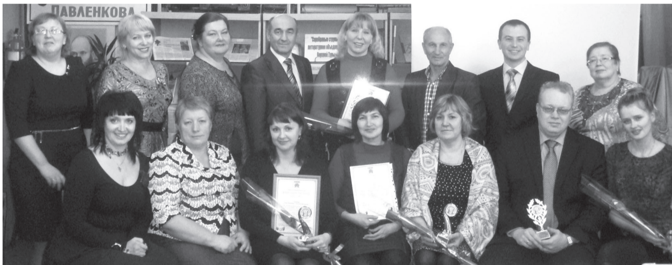
Участники встречи уверены, что жизнь дана на добрые дела

От лица администрации города благодарю всех, кто принял участие в Днях милосердия – предпринимателей, организации, учреждения и, конечно же, рядовых граждан, для которых умение быть добрым и отзывчивым – это не обязанность, а жизненная необходимость. Отрадно, что среди верхнетуринцев таких – большинство. Огромное всем спасибо».