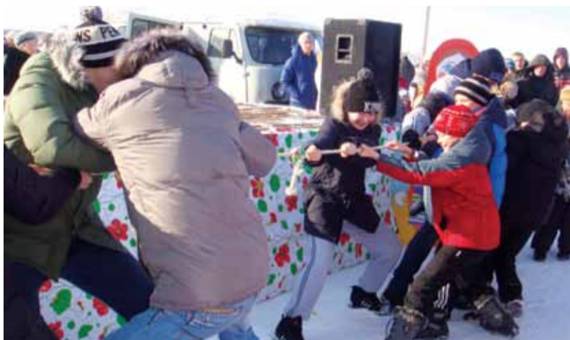
Перетягивание каната - любимая народная забава