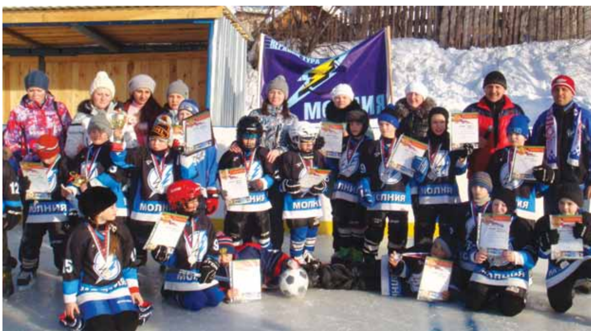
Команда «Молния» - серебряный призер турнира

Родительский комитет выражает огромную благодарность спонсорам турнира: руководству ОАО «ВТМЗ», УК «Верхнету-