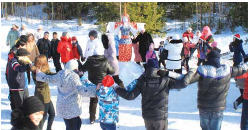
Впервые масленичное гуляние прошло и на тюбинг-трассе

В прошлое воскресенье верхнетуринцы проводили Масленицу.