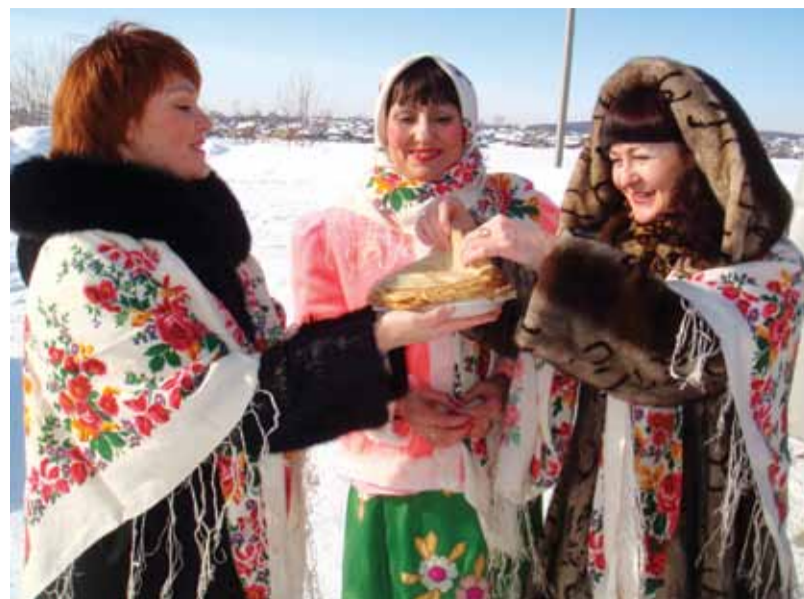
Какая Масленица без блинов!