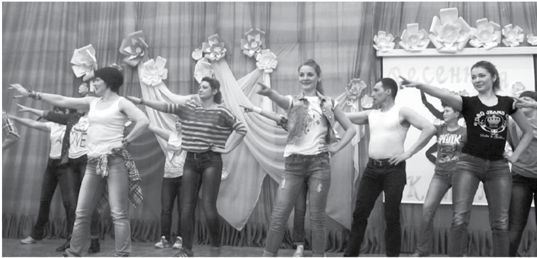
Педагоги блеснули на школьной сцене

В первые дни марта в школе №19 стартовал большой творческий проект - танцевальный фестиваль «Весенняя капель».