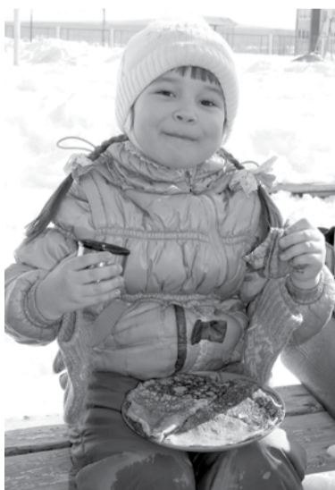
Ах, блинчики, обедение!

12 марта на территории детского сада «Сказка» было шумно и весело - дети и родители группы №7 праздновали Масленицу.