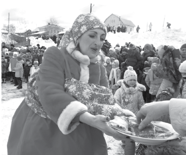
Пришедшая на праздник Масленица угостила зрителей блинами.