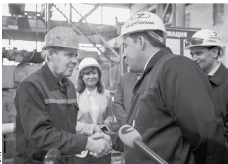
Евгений Куйвашев с работниками Уралмаша

С начала 2016 года индекс промышленного производства в Свердловской области вырос на 23,6 процента. Эти свежие статистические данные вновь подтверждают верность тезиса губернатора Евгения Куйвашева о том, что обрабатывающие производства являются локомотивом промышленности региона и основой роста экономики.