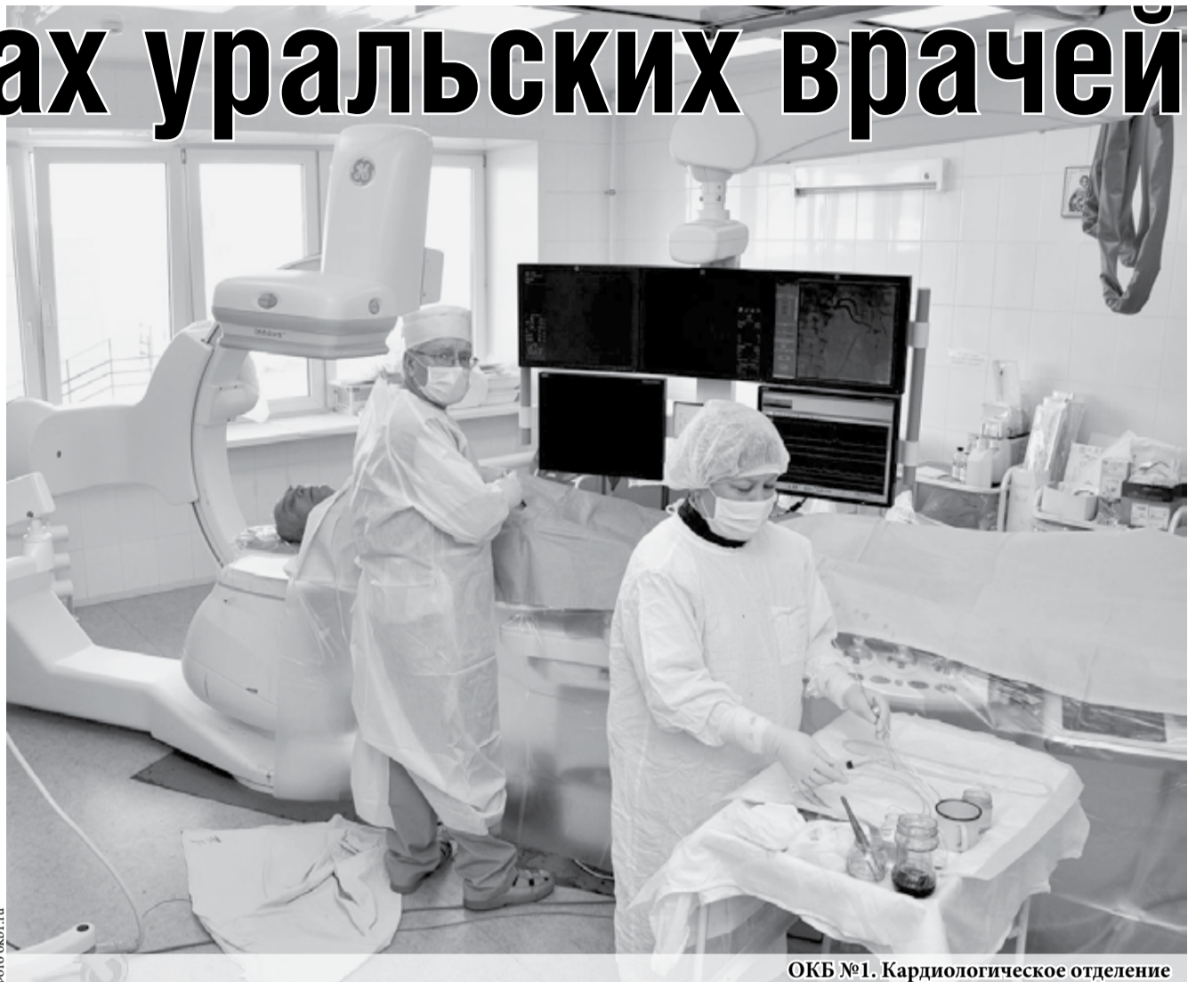
ОКБ №1. Кардиологическое отделение

Мы, члены Совета Медицинской Палаты Свердловской области, не можем оставаться безучастными к тому, что отдельные люди в угоду собственным амбициям и экономическим интересам пытаются использовать недопустимые методы для того, чтобы создать вокруг медиков и их работы исключительно негативную информационную обстановку...».