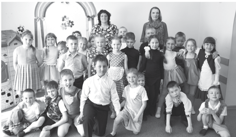
«Теперь мы одна большая дружная семья», - считают дети из «Сказки» и Антоновского детского дома

Пасха и вся Светлая седмица – Пасхальная неделя – это святое время, когда в людях просыпается желание не просто праздновать, а дарить праздник окружающим, заботиться о ком-то, любить ближних. В Пасху каждый человек становится хотя бы чуть-чуть внимательнее, добрее к окружающим. В эти дни люди способны на конкретные, нужные, по-человечески значимые добрые дела!