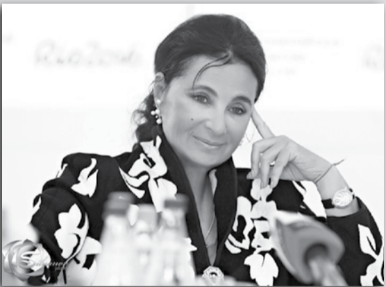
Ирина ВИНЕР, Президент Всероссийской Федерации художественной гимнастики, главный тренер сборной страны