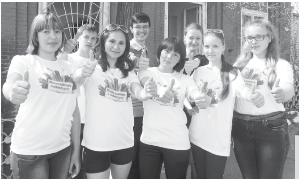
Отряд вожатых к лету готов