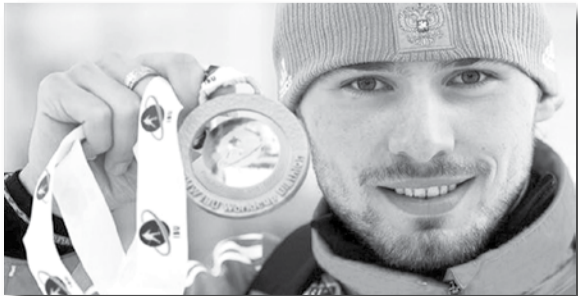
Антон ШИПУЛИН, российский биатлонист, олимпийский чемпион 2014 года в эстафете, бронзовый призёр Олимпийских игр 2010 года, пятикратный призёр чемпионатов мира