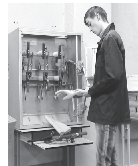
В учебно-производственной мастерской

Прием в ВТМТ проводится без вступительных экзаменов. Перечень документов для поступления и правила приема разме-