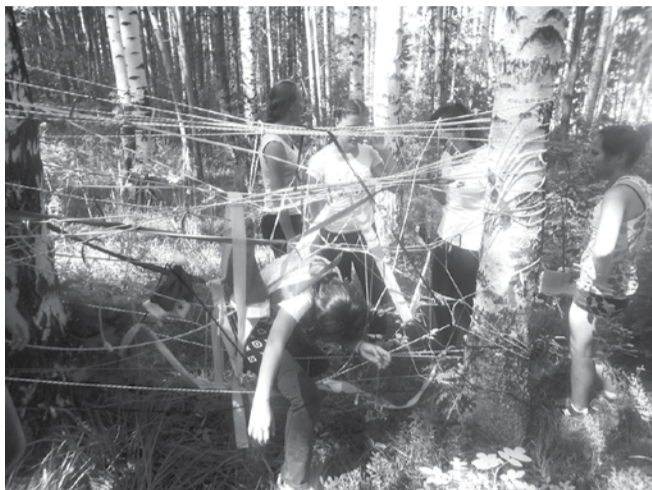
Сквозь путаницу веревок