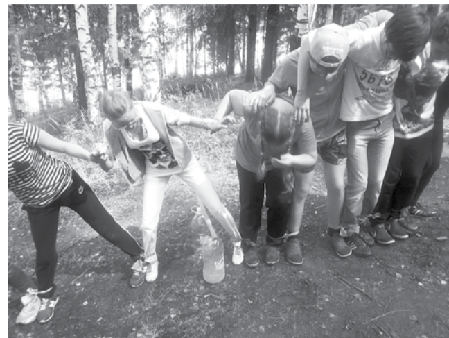
Надо идти со связанными ногами