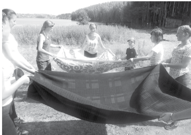
С помощью одеял играли в волейбол