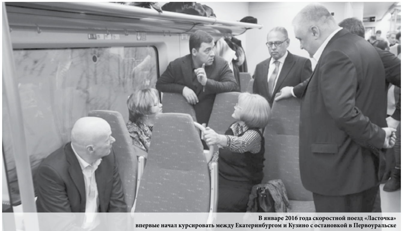
В январе 2016 года скоростной поезд «Ласточка» впервые начал курсировать между Екатеринбург и Кузино с остановкой в Первоуральске