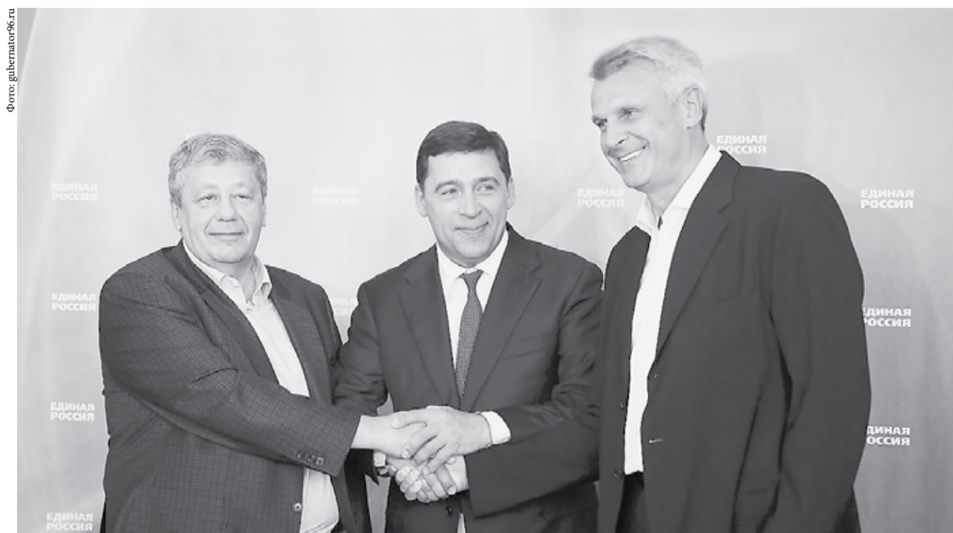
По мнению экспертов, список лидеров – Куйвашев-Чернецкий-Носов – сильнейший за последние двадцать лет.