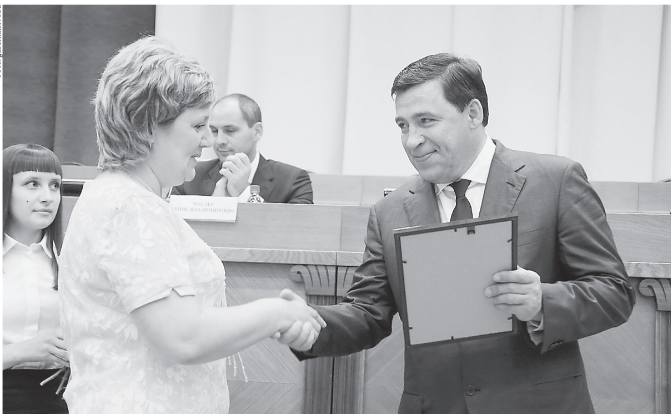
Евгений Куйвашев отметил, что в регионе обязательно будет продолжена работа по материальному стимулированию педагогов. Кроме того, отдельное внимание будет уделено повышению квалификации и решению жилищных проблем учителей.

«Только в 2016 году в систему образования направлено более 81 миллиарда рублей, это первая по значимости и объёму расходов статья бюджета. Наша общая задача – создать необходимые условия для повышения качества образования. В Стратегии социально-экономического развития Свердловской области на 2016-2030 годы сфере образования уделено особое внимание, и это закономерно, поскольку создание конкурентоспособной экономики, современной промышленности, развитой социальной сферы, достойного уровня жизни людей базируется именно на высоком качестве образования».