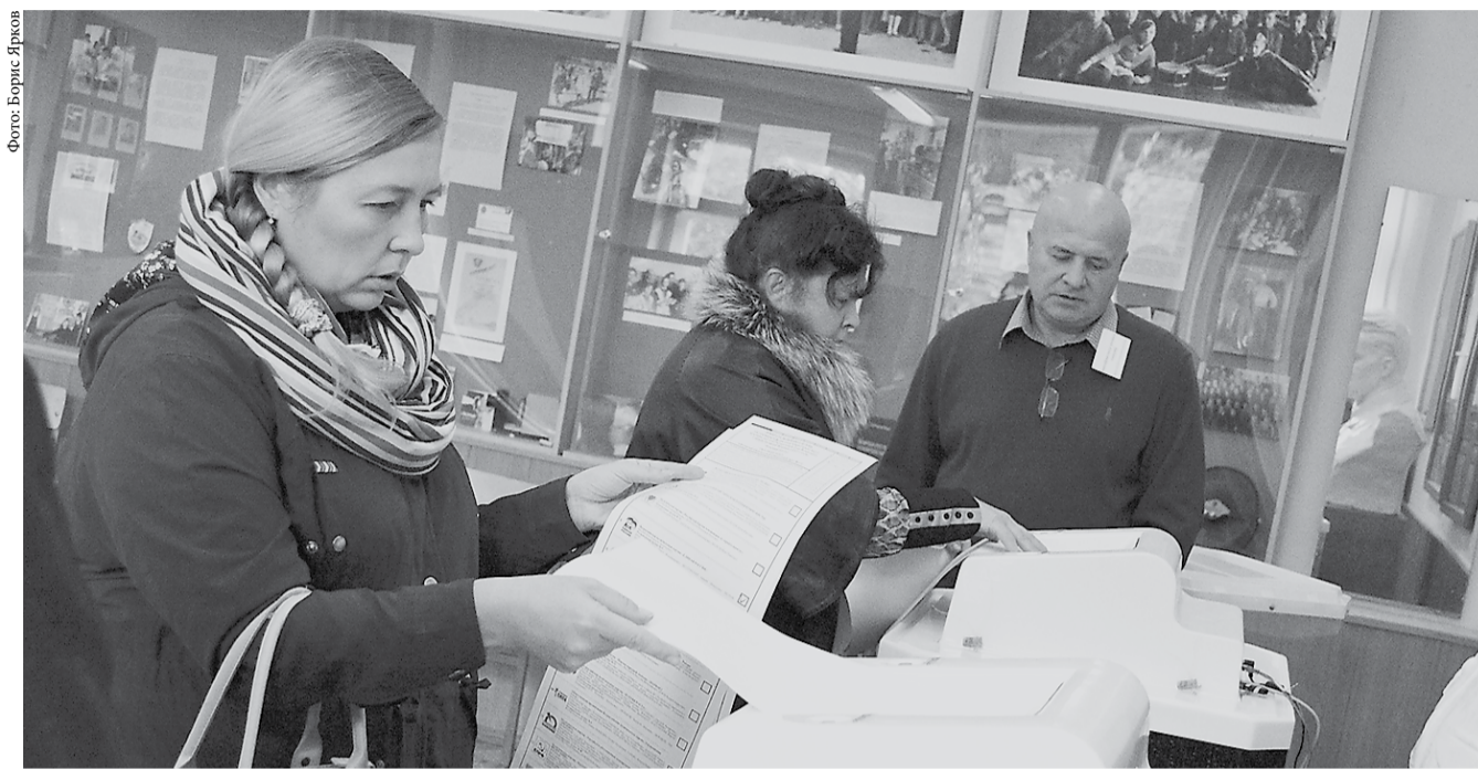
В голосовании на территории Свердловской области могли принять участие около 3,5 миллиона уральцев. Число избирателей, внесенных в список на момент окончания голосования в Свердловской области, 2371925.

Ранее Президент РФ Владимир Путин заявил, что выборы показали растущую политическую зрелость россиян, которые своим волеизъявлением продемонстрировали стремление к стабильной и надёжной ситуации в стране. Глава государства призвал будущих парламентариев от «Единой России» сотрудничать с другими фракциями и искать решения, которые будут приниматься всем обществом.