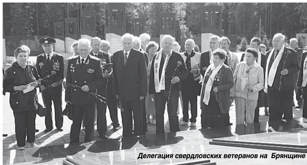
Делегация свердловских ветеранов на Брянщине

Наша поездка проходила в канун 75-летия битвы под Москвой и посещение Истры стала нашим первым остановочным пунктом. Знакомство с местами боевой славы района началось с обзорной экскурсии по Ленино-Снегиревскому мемориальному комплексу и возложения цветов у Вечного огня. У порога истринского Дома ветеранов нас встречали карава-