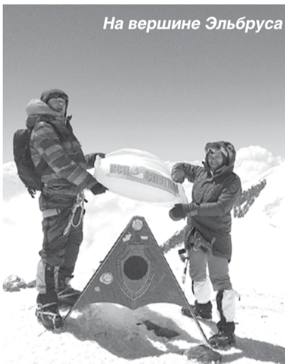
На вершине Эльбруса

20 октября - Международный день статистики