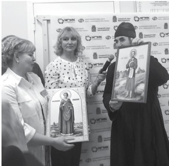
Икона в дар лечебному учреждению

И вот наступил торжественный момент открытия представительства. Среди почетных гостей – министр здравоохранения Свердловской обла-