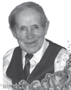
Вся наша дружная семья

Прекрасный возраст – 90! Его прожить не так-то просто! В кругу семьи, в кругу друзей Желаем встретить юбилей! Живи, родной наш, долго-долго, И не считай свои года, Пусть радость, счастье и здоровье Тебе сопутствуют всегда!