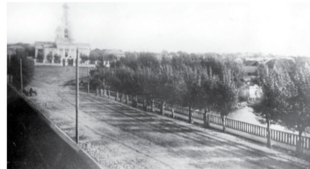
Никольский собор и вид на городскую площадь с западной стороны. 1907 г.

Возможно, в вашем фотоархиве есть фотографии старого города. Принесите их в редакцию, и мы опубликуем их.