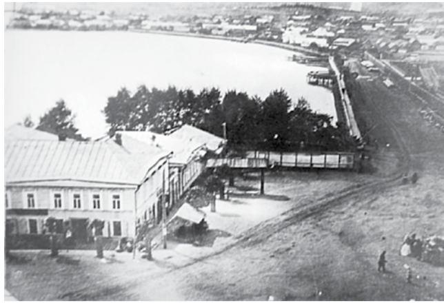
Так выглядела городская площадь в 1907 г.

Вглядись, читатель, в эти фотографии, запечатлевшие наш город в разные годы. Его жители так же, как и сейчас, работали, любили, радовались, огорчались, пели... Это наше прошлое, о котором многие из нас не имеют представления. Пройдет время, и фотографии нашего дня станут историей.