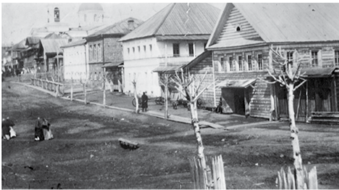
Улица Церковная (ныне Советская). Вид на площадь и Никольский храм. 1907 г.