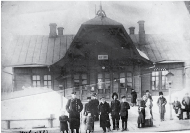
Железнодорожная станция Верхняя, начало XX века.