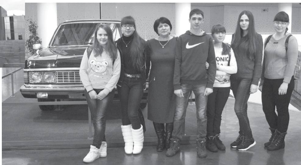
Фото на память на фоне лимузина Б. Ельцина

При желании можно отправиться в 90-е годы: увидеть на пустом прилавке магазина лишь салат «Дальневосточный» из морской капусты и старые деньги, посмотреть старенький телевизор «КВН» и посидеть в троллейбусе, за окнами которого уличный пейзаж двадцатилетней давности... Ощутить прошлое можно, посетив «Ельцин - центр», открывшийся 25 ноября 2015 года в Екатеринбурге.