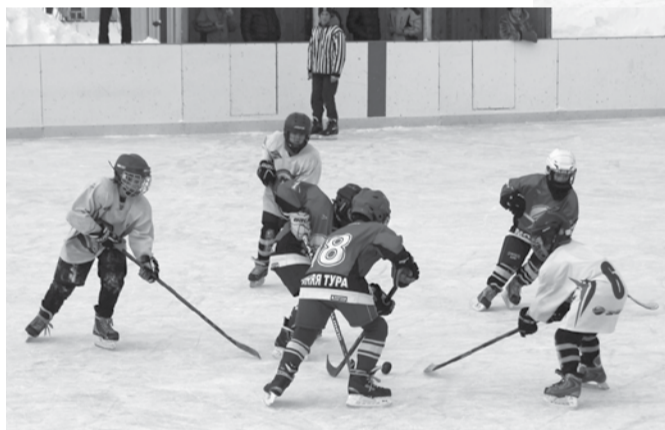
Финальный период последней игры турнира. «Молния-2» ведет со счетом 5 : 2.