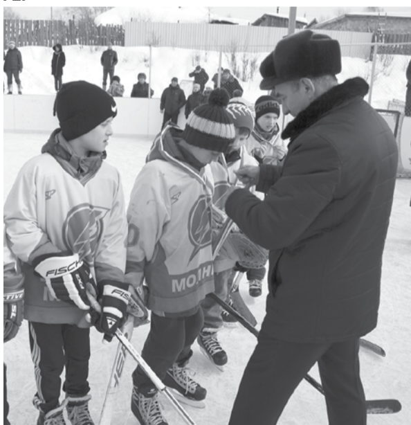
Золотые медали «Молнии-1» вручил глава города Александр Брезгин.

И вот звучит финальный свисток судьи, турнир завершен. Победителем турнира стала команда «Молния-1». На втором месте - команда девушек «Уралочка» (г. Первоуральск), на третьем - «Горняк» (г. Кушва). Четвертое место заняла команда «Мечта» (г. Нижний Тагил), пятое - «Молния-2», шестое место у команды «Кристалл» (г. Качканар).