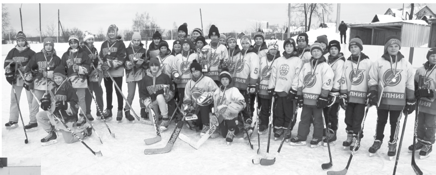
Команды «Уралочка» и «Молния-1»: цветы самым классным и самым прекрасным соперницам.