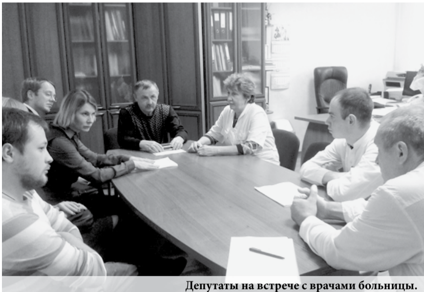
Депутаты на встрече с врачами больницы.