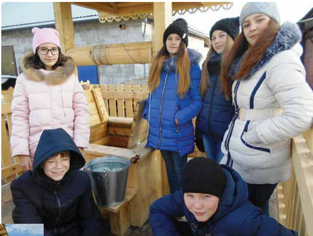
В том, как преобразился колодец «Серебряная роса», есть и заслуга воспитанников «Колоска».

- Действительно, на протяжении 17 лет городской округ В. Тура участвует в областной программе. За это время на территории города было благоустроено 39 источников нецентрали-