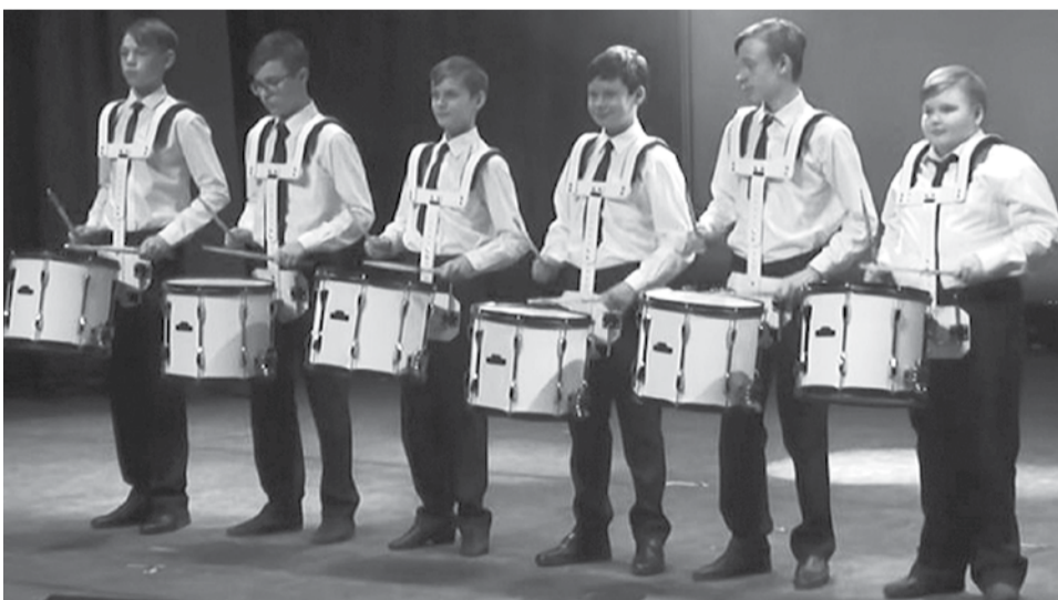
Открыл концерт-презентацию ансамбль барабанщиков

На праздничном концерте присутствовала Министр культуры Свердловской области Светлана Николаевна Учайкина. Она отметила значимость творческого проекта «Знакомьтесь, это мы!» как для каждого города в отдельности, так и области в целом, и выразила благодарность руководству детской филармонии за теплый прием городов области в своих стенах. Тепло министр отозвалась и о выступлении наших артистов, пожелав всем