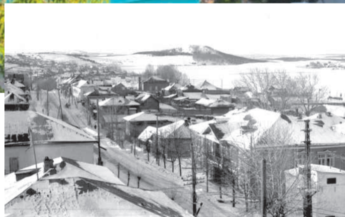
↑ Июль 2018 г. Спустя почти полвека на этом месте вырастет Парк Молодоженов.