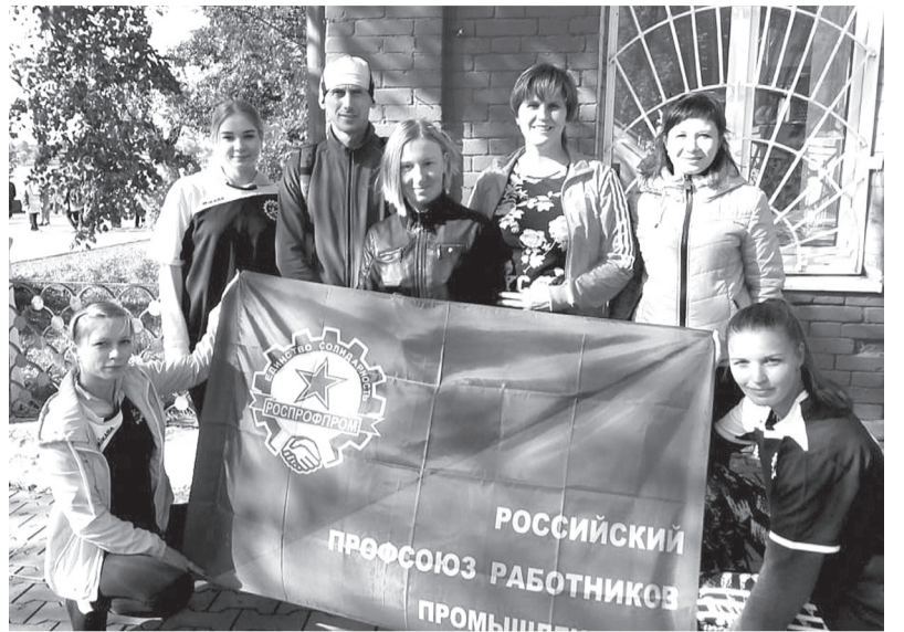
Кросс наций -2018. Спортсмены и профсоюз ВТМЗ

- С какими трудностями вам чаще всего приходится сталкиваться в своей общественной