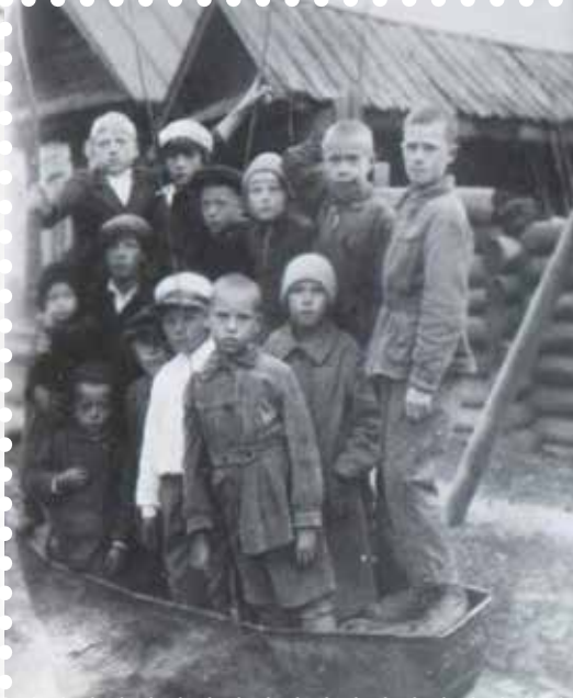
В. Тура. Группа детей на качели «Лодочка», 1939 г.