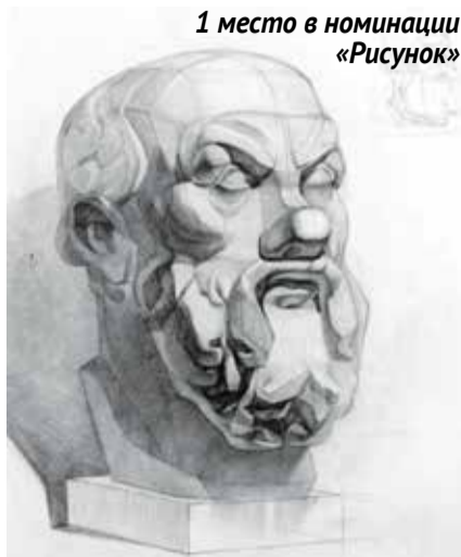
1 место в номинации «Рисунок»

Так же привлекли внимание многофигурные цветные композиции, учащиеся выстраивают пространство за счет цвета и ритмики. При этом сохра-