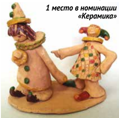
1 место в номинации «Керамика»

Ежегодно на выставку приглашают специалисты в области художе-