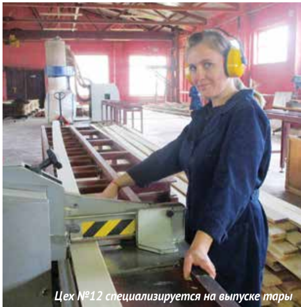
Цех №12 специализируется на выпуске тары