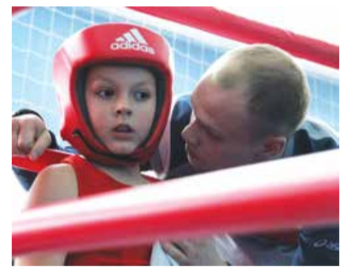
В минувшие выходные в Верхней Туре состоялось Открытое первенство города по боксу, посвященное XXX годовщине вывода Советских войск из Афганистана.