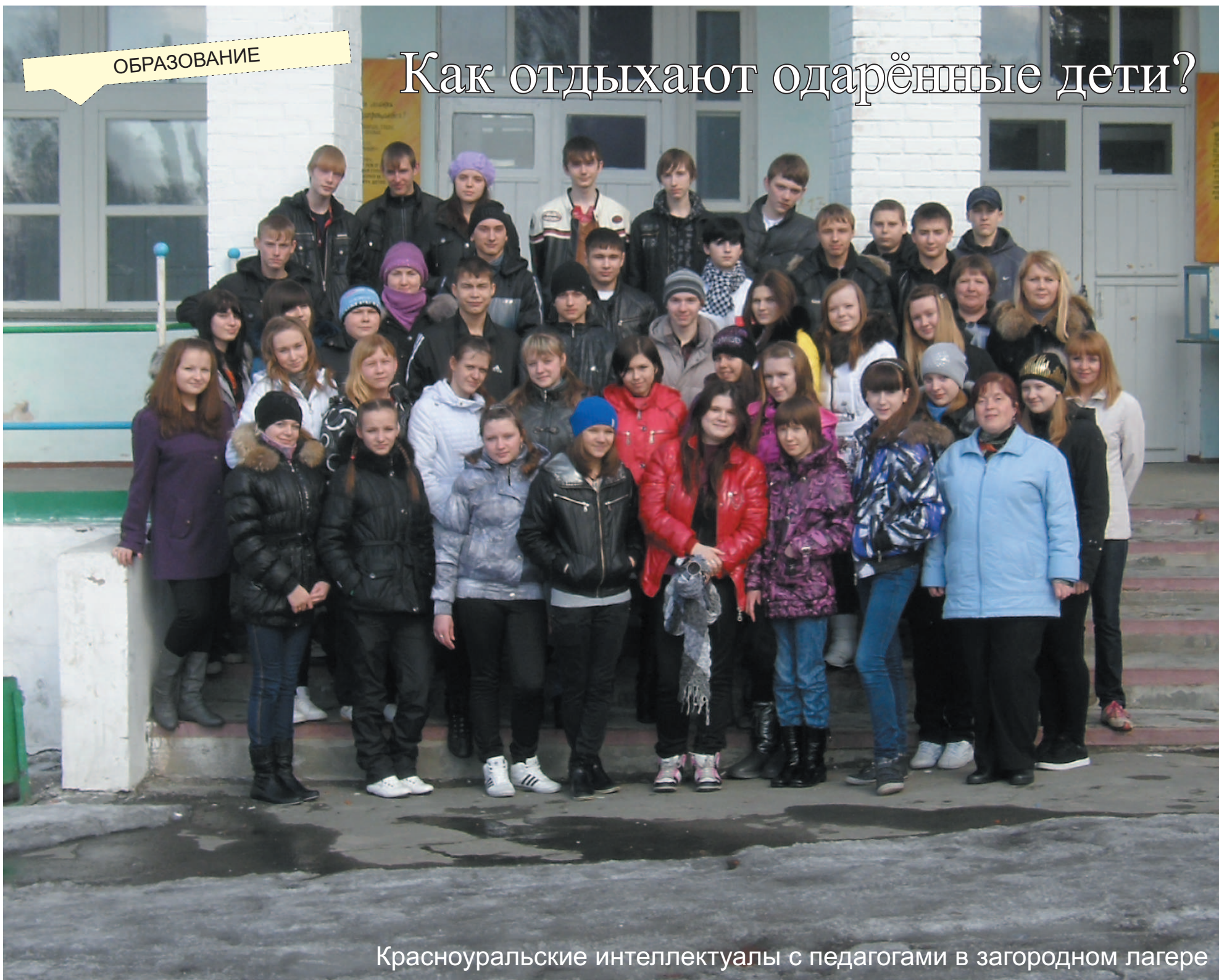
Красноуральские интеллектуалы с педагогами в загородном лагере