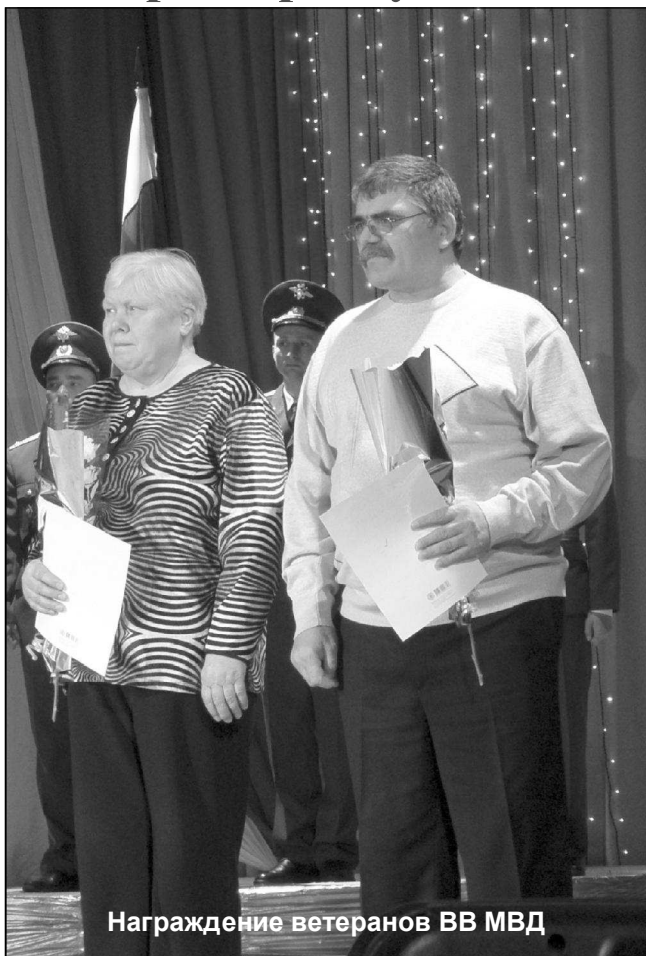
Награждение ветеранов ВВ МВД

27 марта в России отмечалось 200-летие ВВ МВД. 25 марта во Дворце культуры «Металлург» состоялось торжество по поводу юбилея внутренних войск МВД, которое открыли представители комендатуры в/ч 3256.