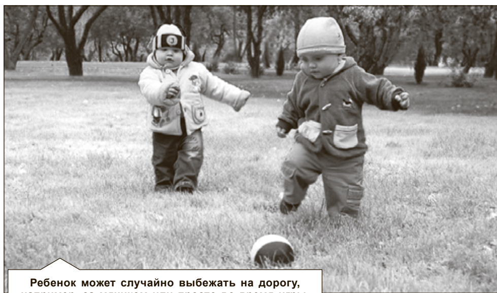
Ребенок может случайно выбежать на дорогу, например, за мячиком или просто во время игры.

А теперь про сам двор. Я запрещаю гулять своим детям во дворе, хотя мне было бы удобнее присматривать за ними из окна, чем тащить их на чужие участки. Почему? Причин несколько: во-первых, наш двор уже очень давно превращен в собаче-кошачий туалет. Соседи (причем в основном люди почтенного возраста) нисколько не стесняются водить гулять своих питомцев на площадку. В песочнице и так уже нет совсем песка (его уже несколько лет не обновляют), так там еще и соседские Барсики и Жучки резвятся. Во-вторых, есть единственная Несломанная игровая конструкция – горка, скат которой выходит аккуратно на дорогу, и там очень опасно. В-третьих,