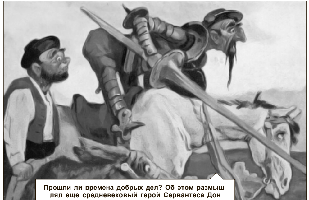
Прошли ли времена добрых дел? Об этом размышлял еще средневековый герой Сервантеса Дон Кихот. Вопрос остался и в 21 веке.