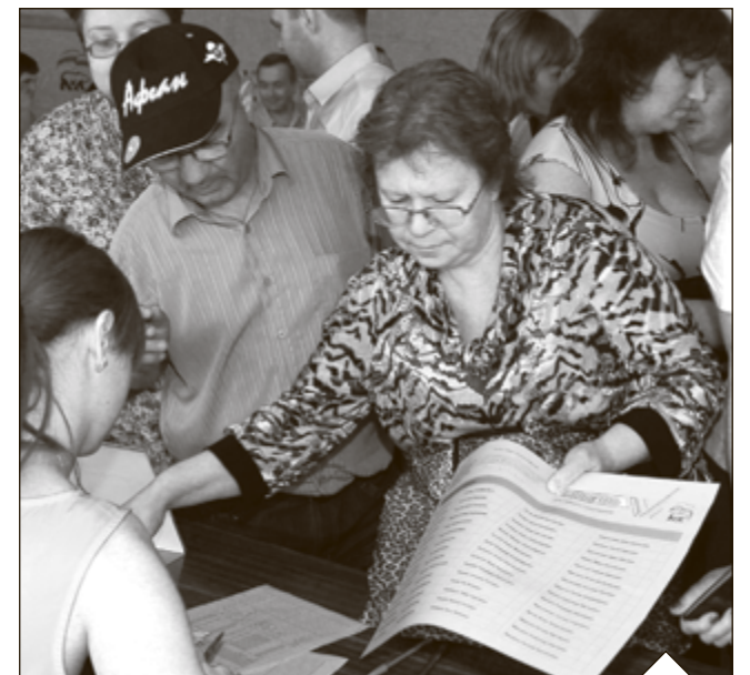
Кандидаты от «ЕДИНОЙ РОССИИ» должны заручиться поддержкой земляков

В этом году лидер партии «ЕДИНАЯ РОССИЯ» Владимир Путин принял принципиальное решение, что четверть мест в списках кандидатов в депутаты Государственной Думы от «ЕДИНОЙ РОССИИ» будет отдана беспартийным - участникам Общероссийского народного фронта. А потому и в предварительном голосовании участвуют люди, которые не являются «единороссами», но кто готов пойти в Госдуму вместе с нами. Я уже говорил, что от партии в предварительном списке - только 35 человек из 120. Остальные - это именно общественники, участники Общероссийского народного фрон-