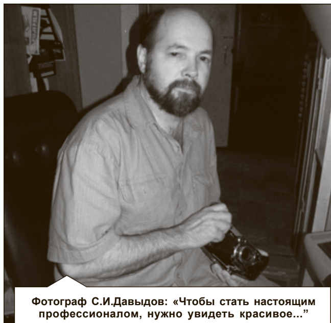
Фотограф С.И.Давыдов: «Чтобы стать настоящим профессионалом, нужно увидеть красивое...»