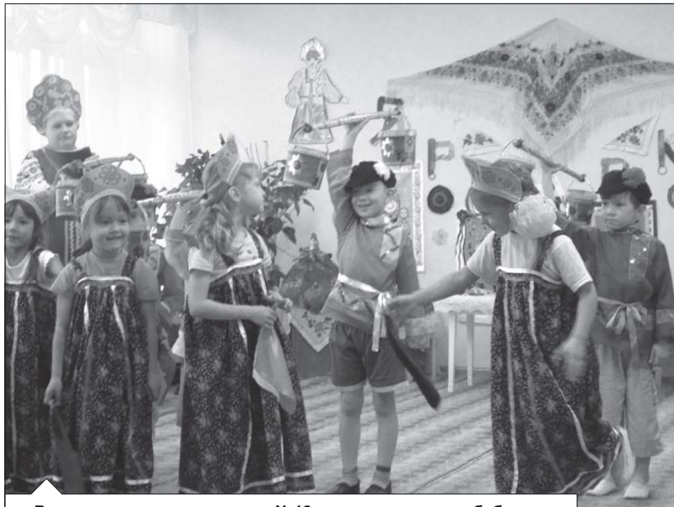
Воспитанники детского сада №18 порадовали своих бабушек и дедушек песнями и плясками.

Как не порадовать этих славных тружеников! Доброй традицией стало про-