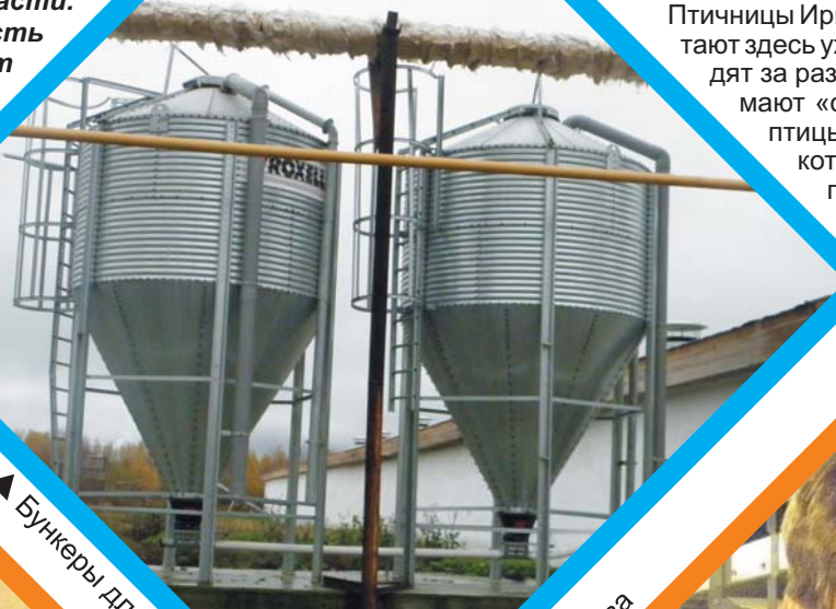
▲ Бункеры для приема комбикорма

В сегодняшнее экономически неустойчивое время приятно осознавать, что есть такие надёжные предприятия, способные обеспечивать продуктами питания наше население. Птицеводство - это специфическая и довольно сложная отрасль, где без слаженного действия всех подразделений не обойтись. В преддверии Дня работников сельского хозяйства от души хочется пожелать коллективу данного агропромышленного предприятия новых трудовых успехов и процветания.