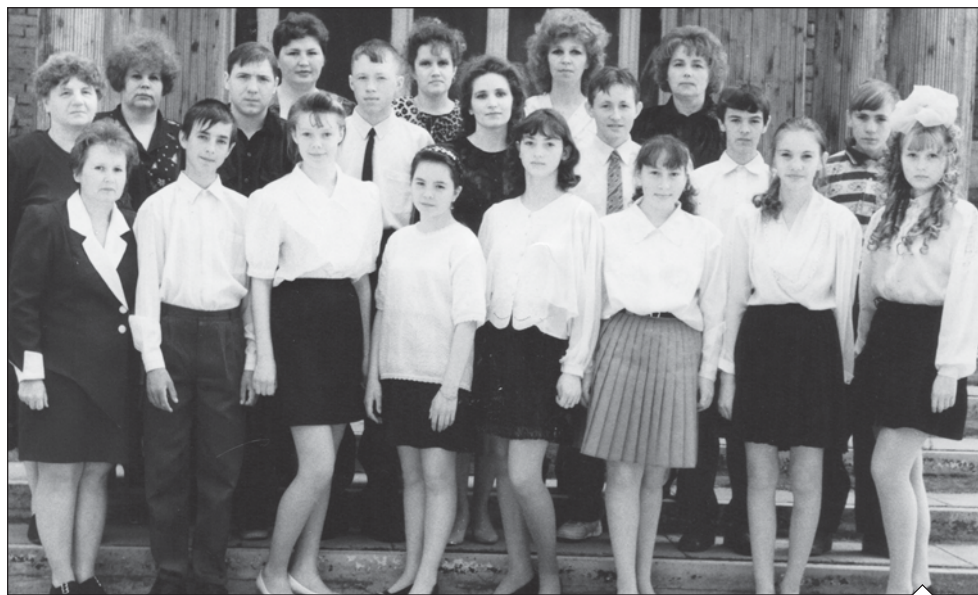
Выпускники 1998 года с учителями на крыльце школы № 10 в «Сосновом бору».

Вновь и вновь вспоминая наш школьный союз, я пришла к мысли: мы как будто всегда стремились увидеть впереди желанный город БРАТСТВА и СЧАСТЬЯ. Ради этого высокого идеала стоило лишать себя покоя и сна, стоило начинать каждый рабочий день с мечты.