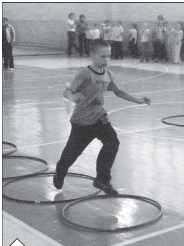
Во время прохождения четвертой эстафеты.

Время на «Веселых стартах» летит быстро. И вот уже семь эстафет позади. Спортивное жюри подводит итоги. В упорнейшей борьбе побеждает команда средней школы № 8. Команду-победи-