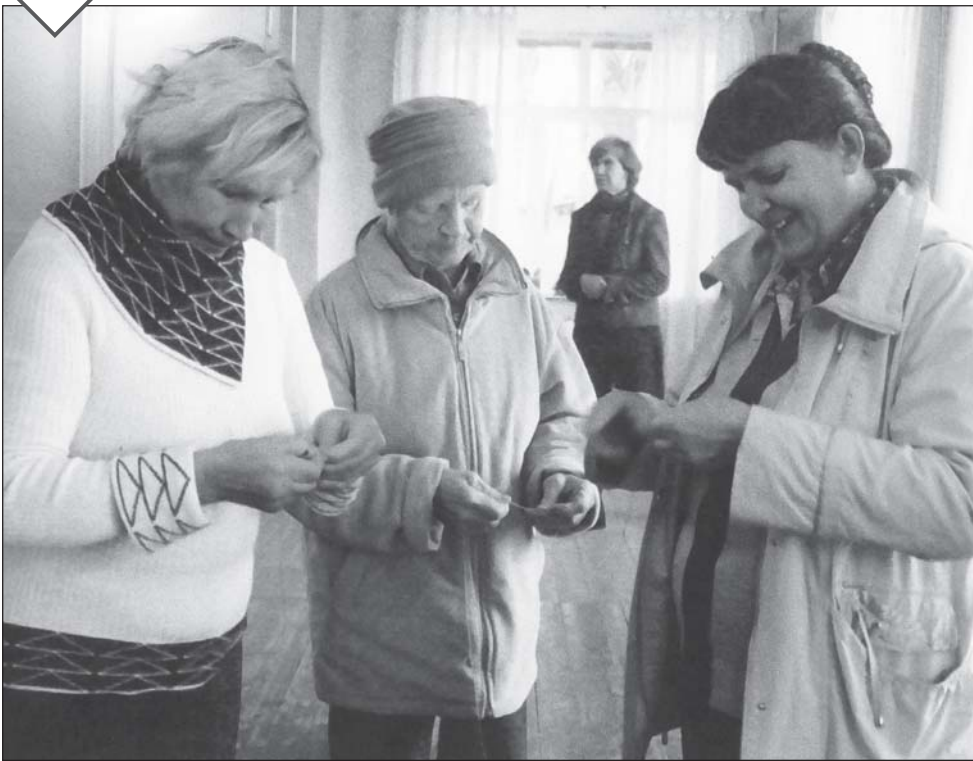
Развязать узелки оказалось нелегко.

ровая программа «Собери урожай», где жители посёлков проявили себя в знании народных примет, пословиц и поговорок, угадывании осенних загадок, исполнении частушек. А участие в юмористических конкурсах развеселило всех присутствующих. Спасибо нашим творческим работникам за праздник!