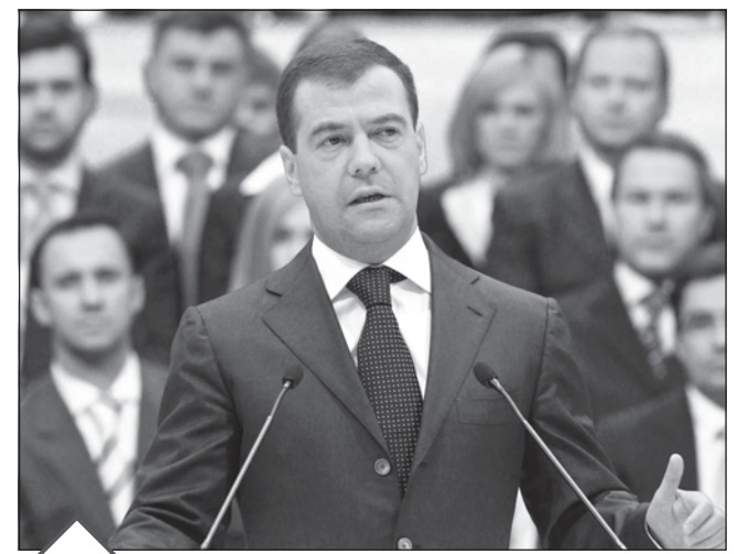
Президентство Дмитрия Медведева ознаменовалось мощным модернизационным рывком, который совершила Россия в целом и Свердловская область в частности. Говорить о том, что Россия достигла небывалых высот, пока преждевременно, но улучшения в качестве жизни очевидны.

Средняя зарплата при Медведеве увеличилась с 17,2 тыс. до 21,1 тыс. руб. В 2007 году Россия вошла в семерку крупнейших экономик мира, оставив позади Италию и Францию. В 2010 году мы поднялись на шес-