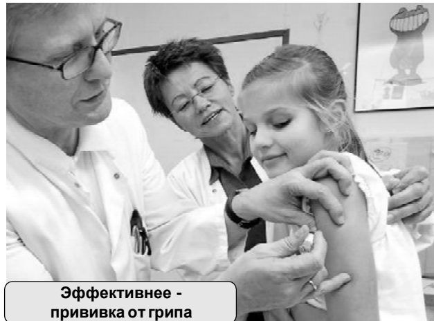
Эффективнее - прививка от гриппа

Жаропонижающие препараты следует принимать при температуре тела выше 38,5 градусов, у детей раннего возраста и с поражениями нервной системы - при температуре выше 38 градусов. Препаратами выбора являются парацетамол, ибупрофен (ибуфен, нурофен). Детям до 15 лет не рекомендуется давать аспирин. Можно применять физические методы охлаждения: