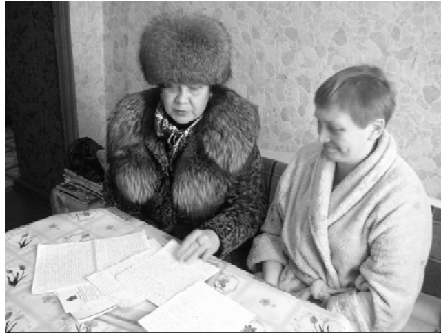
Жители дома № 25 на ул. Карла Маркса не первый год пишут во все инстанции, но сдвигов пока нет.

пительному ремонту дома. Через год с небольшим 1 сентября 2010 года наш дом перешел к ООО «Металлстройсервис», куда мы тоже обращались по