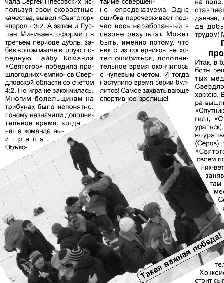
Такая важная победа!