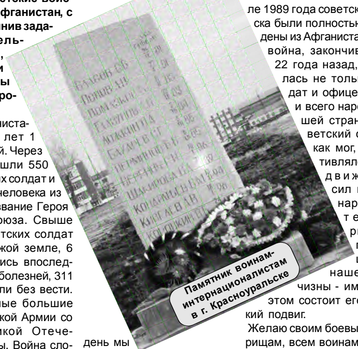
Памятник воинам-интернационалистам в г. Красноуральске

день мы низко склоняем головы перед нашими братьями по оружию, которые не вернулись с полей сражения.