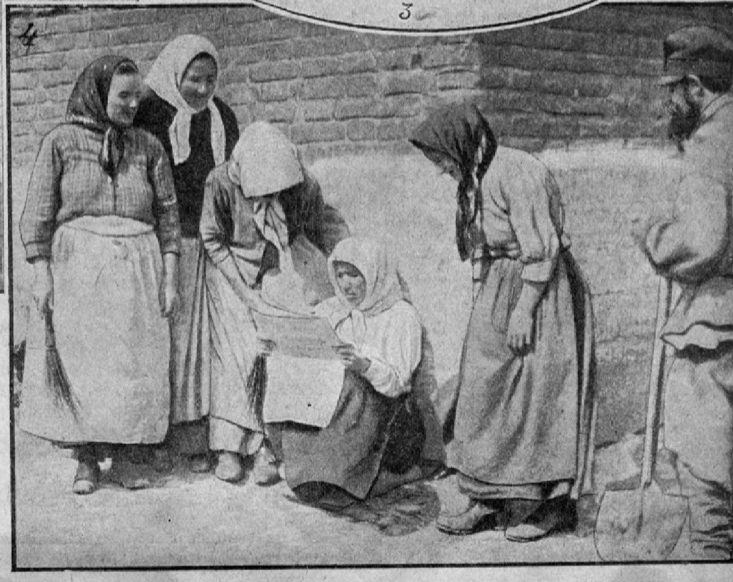
1) Галки пачками гребются на первом весеннем снежинке... 2) Первый корабль. 3) Март... 4) На снежинке. Женщины вышли отдохнуть от работы и греться на солнышке, читают последние известия от войны.

Весной пахнуло... Первые теплые лучи спустились с лазури небес и пригрели землю. Это было 1 марта. Служба сотрудников успела запечатлеть на фотографический пластинок несколько редких и характерных моментов пробуждения природы от зимней спячки... Увы! Петроградская весна не особенно балует жителей столицы и не считается с требованиями календаря: уже 9-го марта, в день официального начала весны, зима злобно насыпалась над городом. В этот день разыгралась снежная вьюга при 12-градусном морозе.