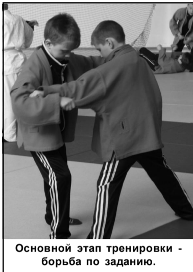
Основной этап тренировки - борьба по заданию.