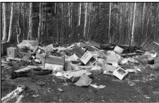
Свалка мусора в лесной чаще в пос. Левинке