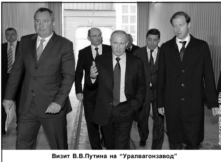
Визит В.В.Путина на "Уралвагонзавод"

Сразу после посещения "Уралвагонзавода" Президент России Владимир Путин здесь же, в Нижнем Тагиле, провел совещание на тему «О новых требованиях к российскому оборонно-промышленному комплексу». Участие в нем приняли главы ряда федеральных Министерств и ведомств, губернатор Свердловской области Александр Мишарин, полномочный представитель Президента РФ в Уральском федеральном округе Евгений Куйвашев, генеральный директор ООО «НПК «Уралва-