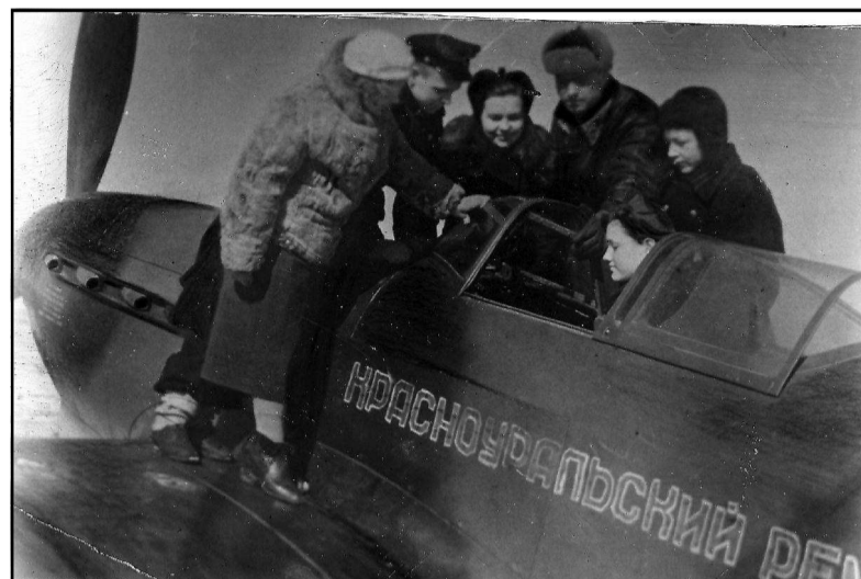
Красноуральская делегация в г. Новосибирске, осень 1942 года. На собранные деньги учащихся и преподавателей РУ № 8 был построен самолет «Красноуральский ремесленник».