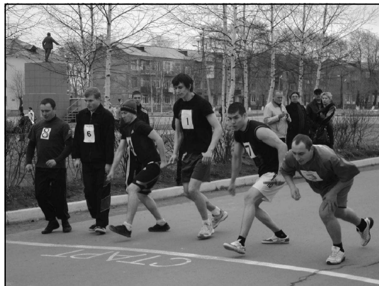
На старт... Внимание... Марш!