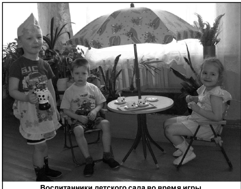
Воспитанники детского сада во время игры.

Нашему садiku жить дальше, и мы поздравляем всех нынешних и бывших работников детского сада № 22 с таким большим юбилеем. Пусть сбываются мечты, а наши дети здесь растут счастливыми!