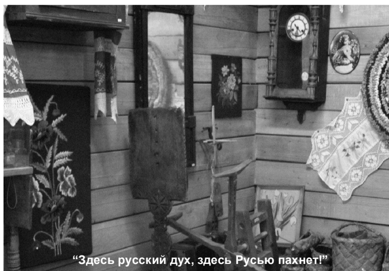
«Здесь русский дух, здесь Русью пахнет!»