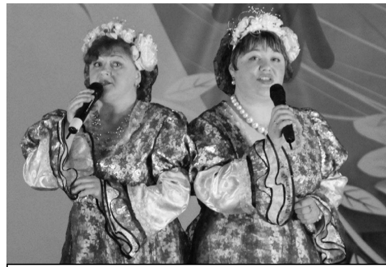
Вокальный дуэт «Гжелка» (г. Красноуральск).

Более трех часов участники конкурса владели зрительскими эмоциями, вызывая и слезы, и смех, и аплодисменты. Было много чтецов. Причем читались не только произ-