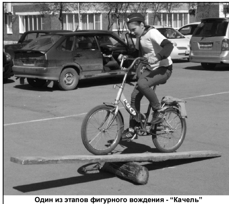
Один из этапов фигурного вождения - «Качель»

Этап «Автогородок» проходил на улице и носил практический характер. Участники на велосипедах проехали по участку, выполнили требования регулировщика, требования дорожных знаков и дорожной разметки. Во время фигурного вождения, которое также являлось одним из прак-