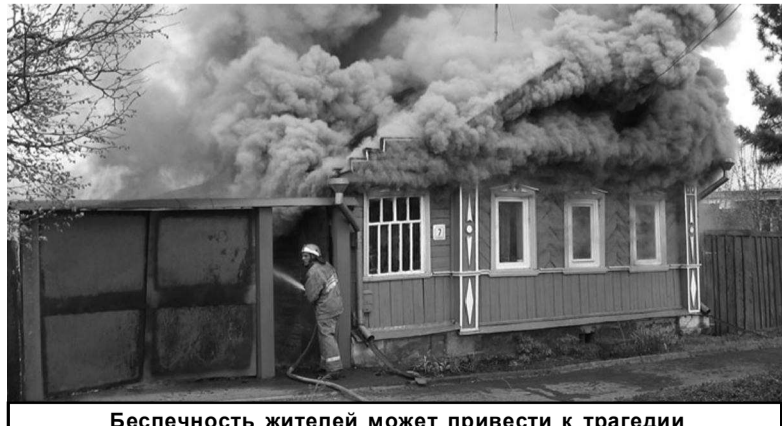
Беспечность жителей может привести к трагедии

Вызов экстренных служб с мобильных телефонов бесплатный.