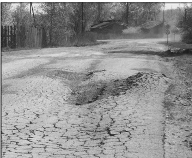
а дорога стала непроезжей уже сейчас.