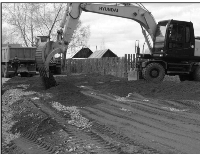
Ремонтировали в начале мая,

- Почему все водители, являющиеся налогоплательщиками, должны в прямом смысле убивать свои дорогостоящие автомобили? До каких пор это будет продолжаться? Ведь здесь шофёры должны «выписывать» виражи, достойные «Формулы-1», причем на обычной дороге.