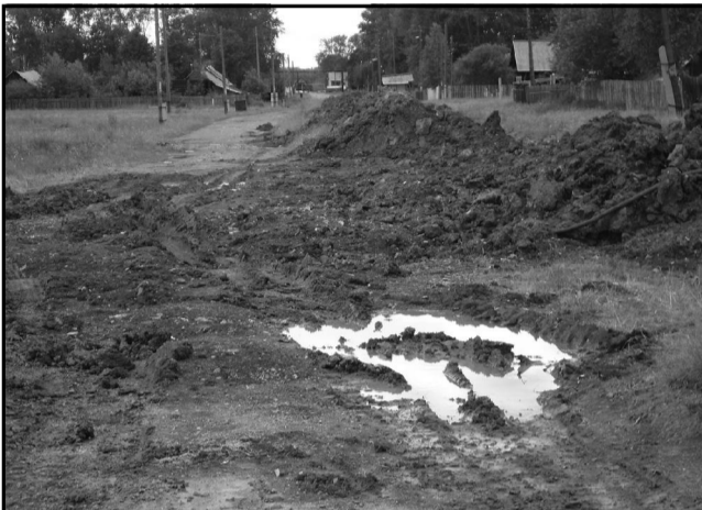
Пос. Октябрьский. Раскопки произведены, вторую неделю ждем экскаватор и сварочный аппарат