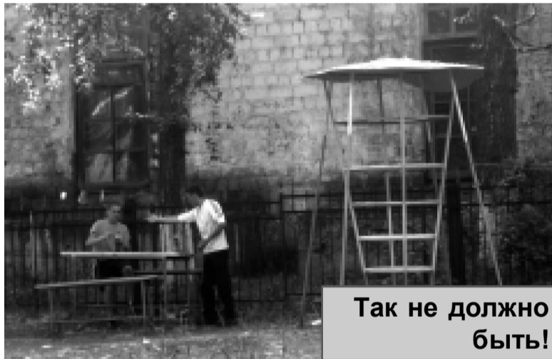
Так не должно быть!

ОПРОС В ТЕМУ: Как относятся красноуральцы к распитию алкогольных напитков на детских площадках (в общественных местах)?