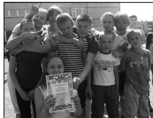
Команда школы №8 - серебряный призер спортивного праздника Большой хоровод

Все победители и призеры награждены грамотами МКУ «УФК, -СимП» и сладкими призами.