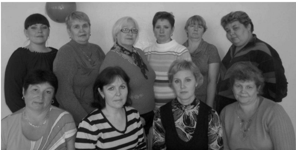
Коллектив д/с № 30