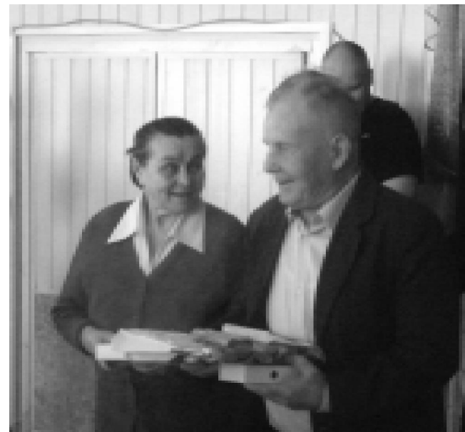
Награда супругам за создание крепкой семьи.