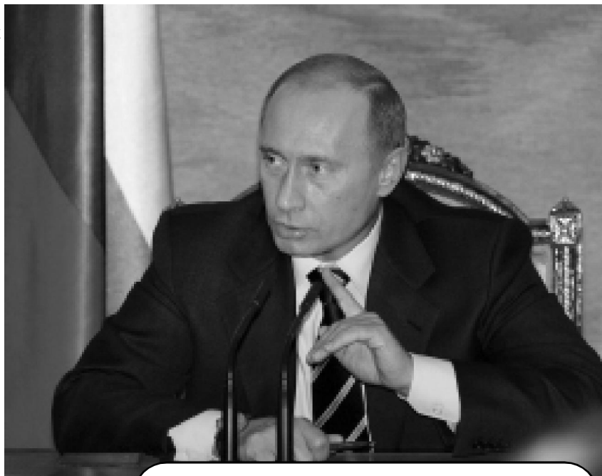
В.В. Путин: «Обновленная экономика должна дать перспективу реализации каждому — и предпринимателям, и работникам бюджетной сферы, инженерам и квалифицированным рабочим».

За каждым макроэкономическим показателем, за каждым конкретным проектом мы должны видеть, сколько новых рабочих мест это принесет России, как это изменит качество занятости, а значит, и качество жизни людей.