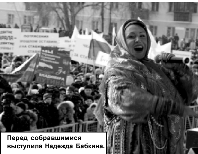
Перед собравшимися выступила Надежда Бабкина.

На Привокзальной площади в Екатеринбурге в субботу, 28 января прошел митинг, организованный комитетом корпорации «Уралвагонзавод» в поддержку кандидата в президенты Владимира Путина. Ориентировочное количество участников, которое заявлено на эту акцию - 10-12 тыс человек. "Интерфакс" со ссылкой на ГУВД по Свердловской области сообщил о 15 тысячах митингующих. Организаторы заявили, что вышло около 14 тысяч.