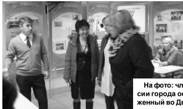
На фото: члены эвакуационной комиссии города осматривают ПЭП, расположенный во Дворце спорта «Молодость».

Сегодня в Красноуральске проходит межмуниципальная тренировка по эвакуации населения с развертыванием приемно-эвакуационного пункта (ПЭП).