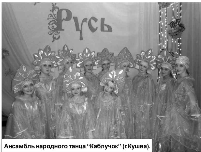
Ансамбль народного танца "Каблучок" (г.Кушва).