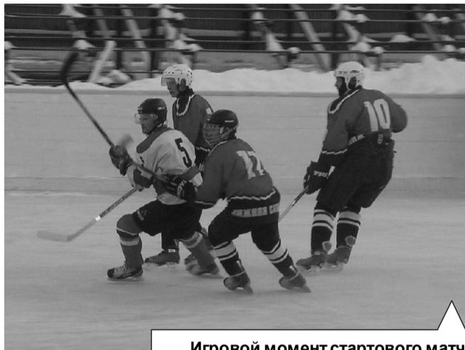
Игровой момент стартового матча «Святогора» в сезоне 2012-2013 г.г.

- Подготовку к сезону 2012-2013 г.г. команда начала четыре месяца назад, в августе. Для качественной игры одной физподготовки в зале недостаточно. Нужно катание и еще раз катание! Это понимали все ребята. И я как тренер благодарен им за то, что, войдя в наше положение, они не считались с деньгами и с личным временем, когда арендовали искусственный лед в Н.Тагиле. Естественно, что нам его предоставляли в самую последнюю очередь. Иные тренировки приходилось проводить в половине одиннадцатого вечера. Хочу также поблагодарить хокке-