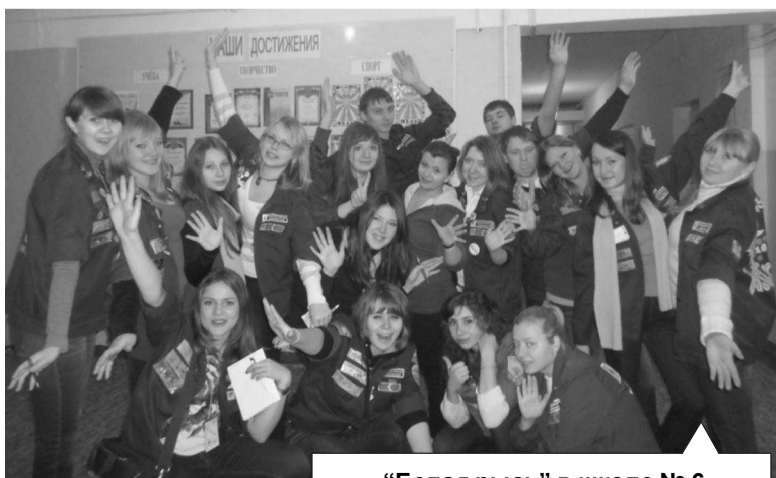
«Белая рысь» в школе № 6

Молодежный отряд «Белая рысь» десантировался в нашем городе на прошлой неделе.