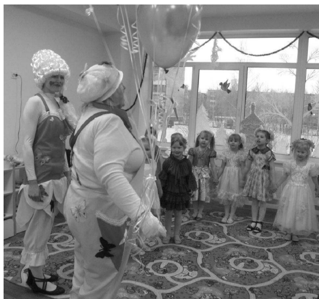
Игринка и Веселинка развлекают первых обитателей «Березки»

17 декабря в нашем городе произошло радостное событие: появился на свет новый детский сад «Берёзка». Этого ждали многие родители более полугода, и вот, наконец, 110 детей будут посещать шесть групп детского сада № 9.