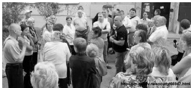
Совет многоквартирного дома может определить перечень помещений, входящих в состав общедомового имущества