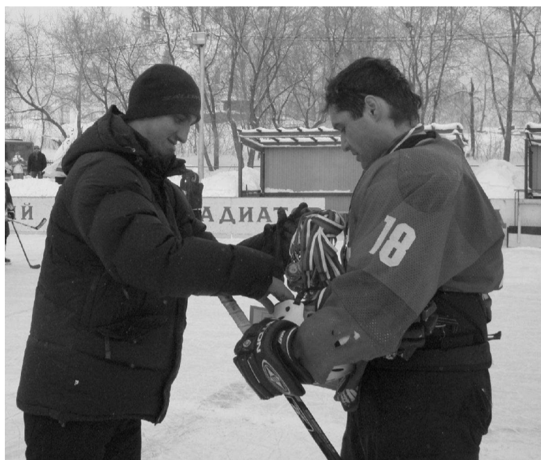
Надеемся, что в сезоне 2012-2013 гг. команда «Святогор» вновь завоюет медали первенства Свердловской области по хоккею.