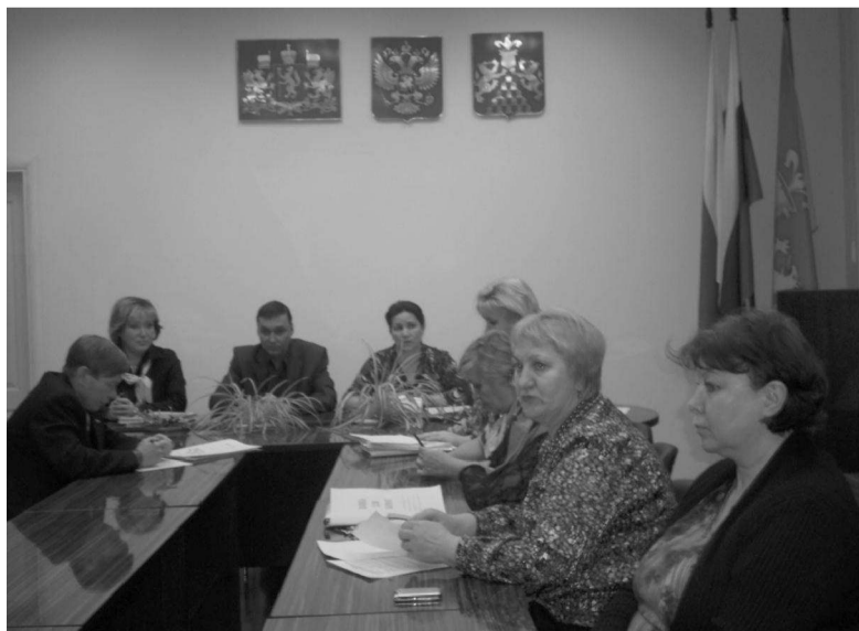
На фото: идут публичные слушания