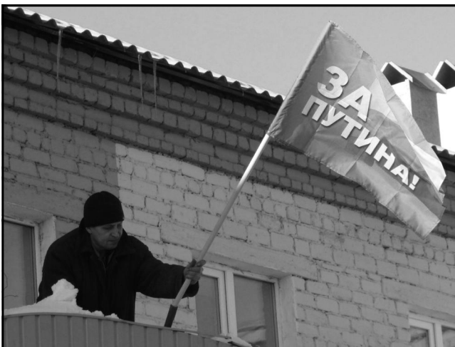
Еще над многими учреждениями и предприятиями Красноуральска уже развеваются флаги как символ единства трудовых коллективов накануне выборов.

Остается добавить, что уже около полутора тысяч работников ОАО «Святогор» присоединились к резолюции, а символические флаги развеваются почти над двумя десятками зданий промышленной площадки комбината.