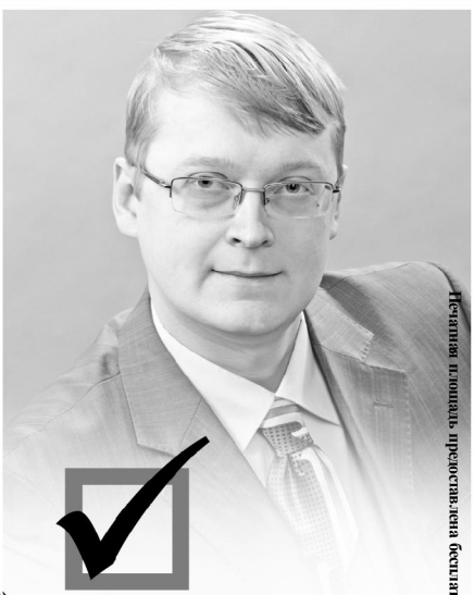
Кандидат в депутаты, председатель общественной организации «Управдом»

Действующий депутат Думы, знает, как поднять жилищно-коммунальное хозяйство города на должный уровень, и уже делает это! В числе приоритетных задач - дальнейшее развитие ЖКХ и повышение качества коммунальных услуг.