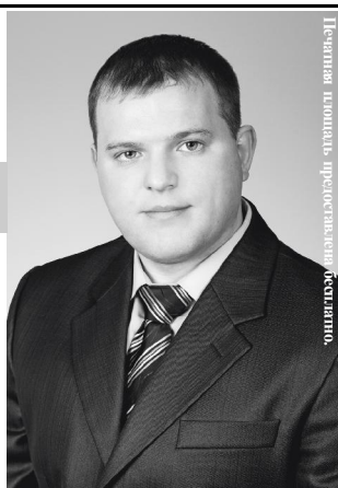
Печатная площадь предоставлена бесплатно.

Кандидат в депутаты городской Думы по избирательному округу № 4