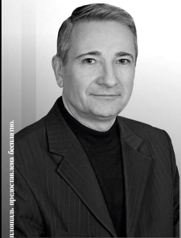
Пенсионер, кандидат в депутаты, председатель общественной организации «Справедливая Россия»