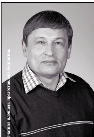
Печатная площадь предоставлена бесплатно.

-учредитель, издатель и редактор независимой общественно-политической газеты «Пульс города».