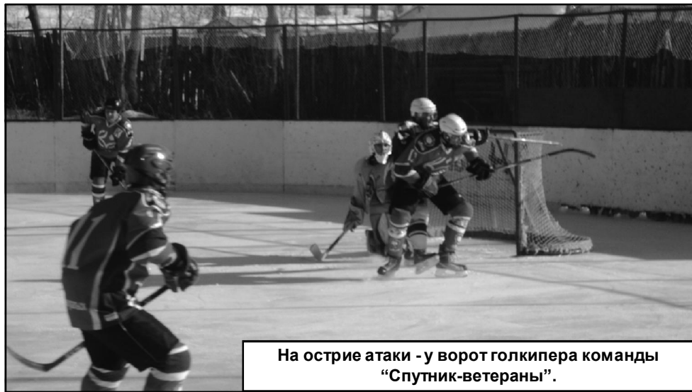
На острие атаки - у ворот голкипера команды «Спутник-ветераны».

До окончания сезона «Святогору» осталось провести две игры с командой «Союз НТ» (Н. Тагил) в борьбе за пятое-шестое место. Первый матч этой серии состоится в Красноуральске в ближайшую субботу, 3 марта. Начало матча в 14.00. Не пропустите!