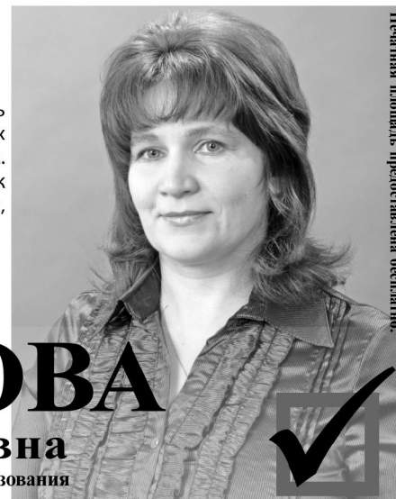
Печатная площадь предоставлена бесплатно.

Примите самые искренние поздравления с наступающим 8 Марта и пожелания здоровья, красоты и улыбок!