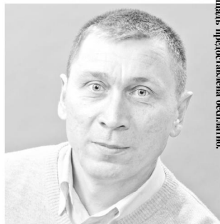
Печатная площадь предоставлена бесплатно.

Примите самые искренние поздравления с наступающим Международным женским днем 8 Марта!