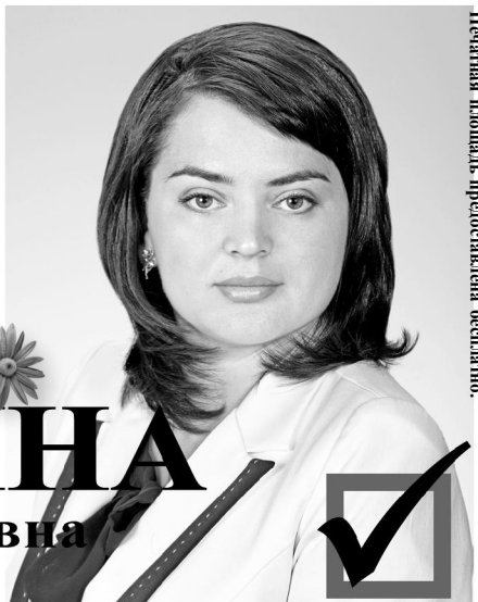
Печатная площадь предоставлена бесплатно.

От всего сердца поздравляю вас с наступающим женским Днем 8 Марта! Искренне желаю вам нежности, улыбок, радости материнства, весеннего настроения и, конечно, исполнения всех ваших желаний. Будьте любимы!