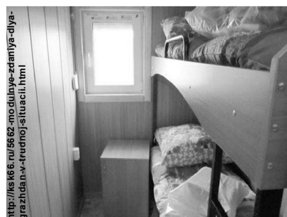
Так выглядит двухместное купе в модульном здании

На сегодняшний день в «Надежде» зарегистрированы 38 граждан без определённого места жительства, из них - 26 мужчин и 12 женщин. Всего на учете в отделе внутренних дел Красноуральска зарегистрированы 56 человек без определенного места жительства.