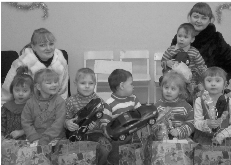
Дед Мороз каждому вручил игрушку, о которой ребенок мечтал

Надеемся на дальнейшую помощь и поддержку в новом, 2013 году!