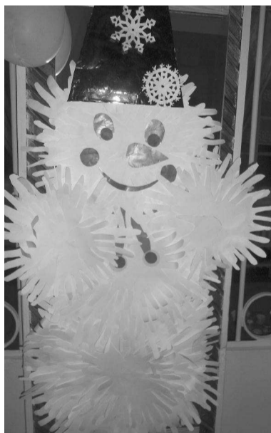
Этот Снеговичок встречает детей в школе

Учащиеся нашей школы приняли активное участие в городских конкурсах «Волшебная снежин-