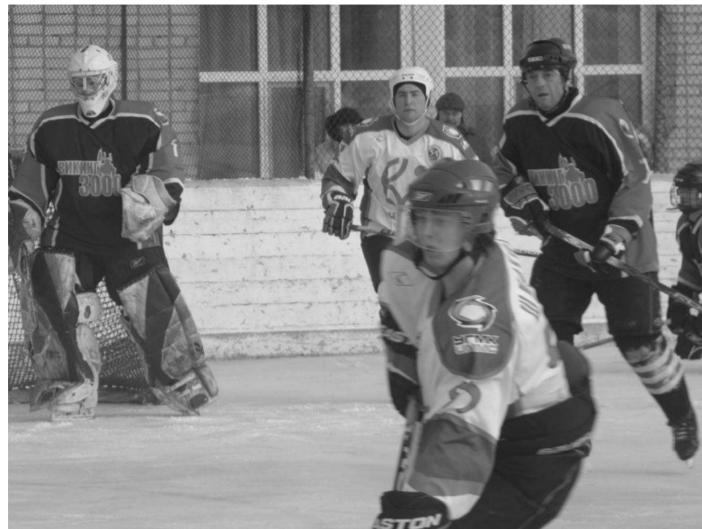
«В суровый бой идет ледовая дружина». Во время атаки на ворота соперника