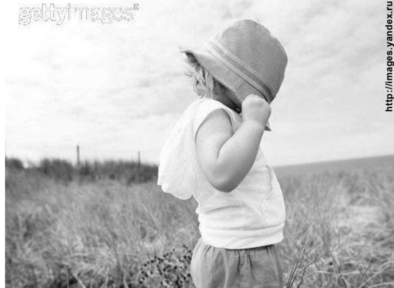
Застенчивый ребенок нуждается в трепетном и бережном обращении

* Формируйте у ребенка уверенность в себе и адекватную самооценку: уверенность в себе вырабатывается за счет успеха. Ставьте перед ребенком задачи, которые он может