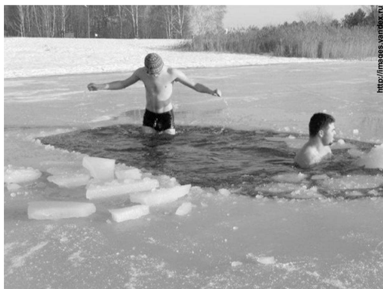
Купаться или не купаться? Вот в чем вопрос!

«ЗА»: Действительно, купание в проруби – отличный способ укрепления здоровья и повышения иммунитета. При погружении человека в холодную воду происходит выброс гормона надпочечников – адреналина. Его называют гормоном стресса, он отвечает за адаптацию к экстремальным условиям. Адреналин снижает болевую чувствительность, учащает сердцебиение, улучшает кровенаполнение внутренних органов и мозга, активизирует иммунную систему, запускает выработку тепла. Но, чтобы купаться в проруби, нужно быть совершенно здоровым человеком или пройти процесс закаливания в течение длительного времени. И даже таким людям перед погружением в воду надо