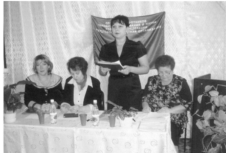
Во время городской отчетно-выборной профсоюзной конференции

Профсоюза. Большая работа проведена в области охраны труда работников: из 214 запланированных мероприятий в учреждениях образования проведено 195 (91,1%), прошёл городской смотр-конкурс по охране труда, участвовали и в областном смотре. Дано большое количество консультаций, разрешены конфликтные ситуации. За 2012 год 120 работников образования поправили своё здоровье: из них 112 человек – в санатории-профилактории «Солнечный», восемь – в профсоюзном санатории «Юбилейный». Через коллективные договоры и городское соглашение наши работники получили ряд дополнительных льгот: 141 человек – дополнительно оплачиваемые отпуска, 28 руководи-