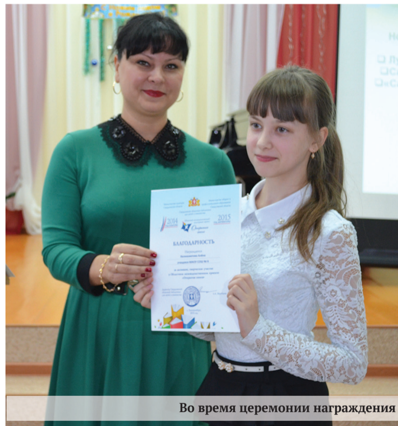
Во время церемонии награждения

В соответствии с указом президента Российской Федерации