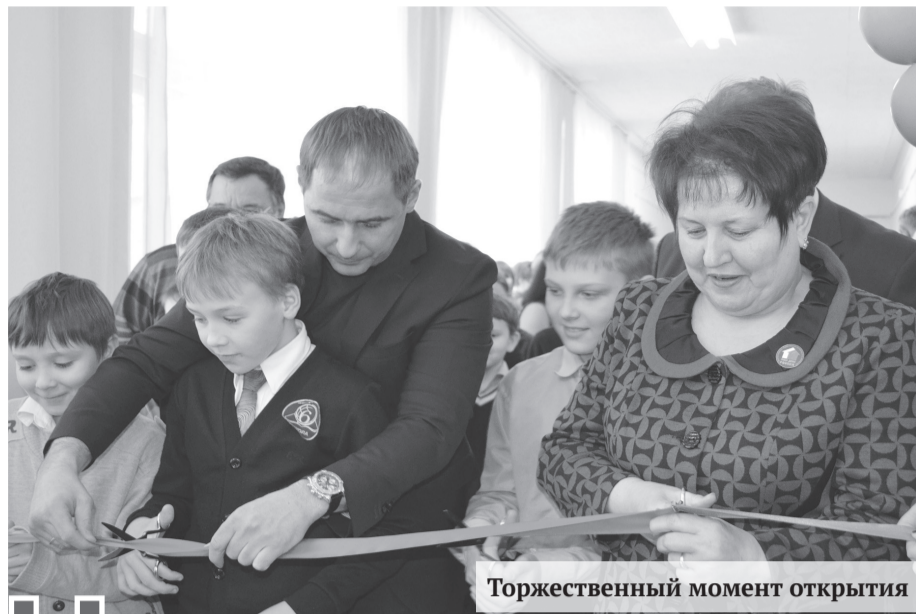
Торжественный момент открытия