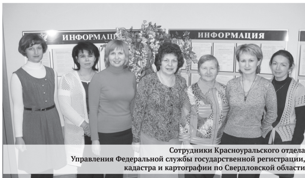
Сотрудники Красноуральского отдела Управления Федеральной службы государственной регистрации, кадастра и картографии по Свердловской области