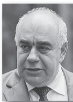
Аркадий Белявский, министр здравоохранения Свердловской области:

«Мы смещаем акцент с оказания медицинской помощи в круглосуточных стационарах на поликлиническую и амбулаторную помощь. В результате всех преобразований: оптимизации сети учреждений, внедрения эффективных контрактов удалось сэкономить 558 миллионов рублей, которые были направлены на повышение заработной платы медицинским работникам».