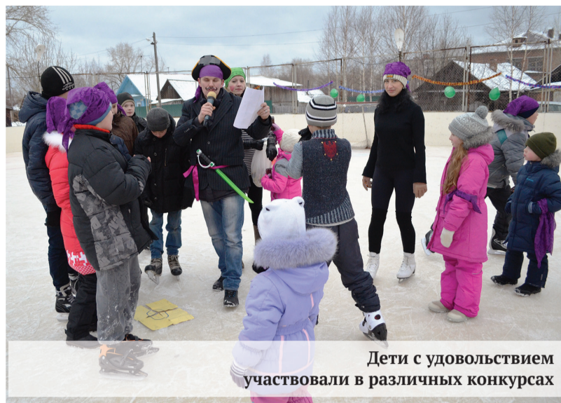
Дети с удовольствием участвовали в различных конкурсах