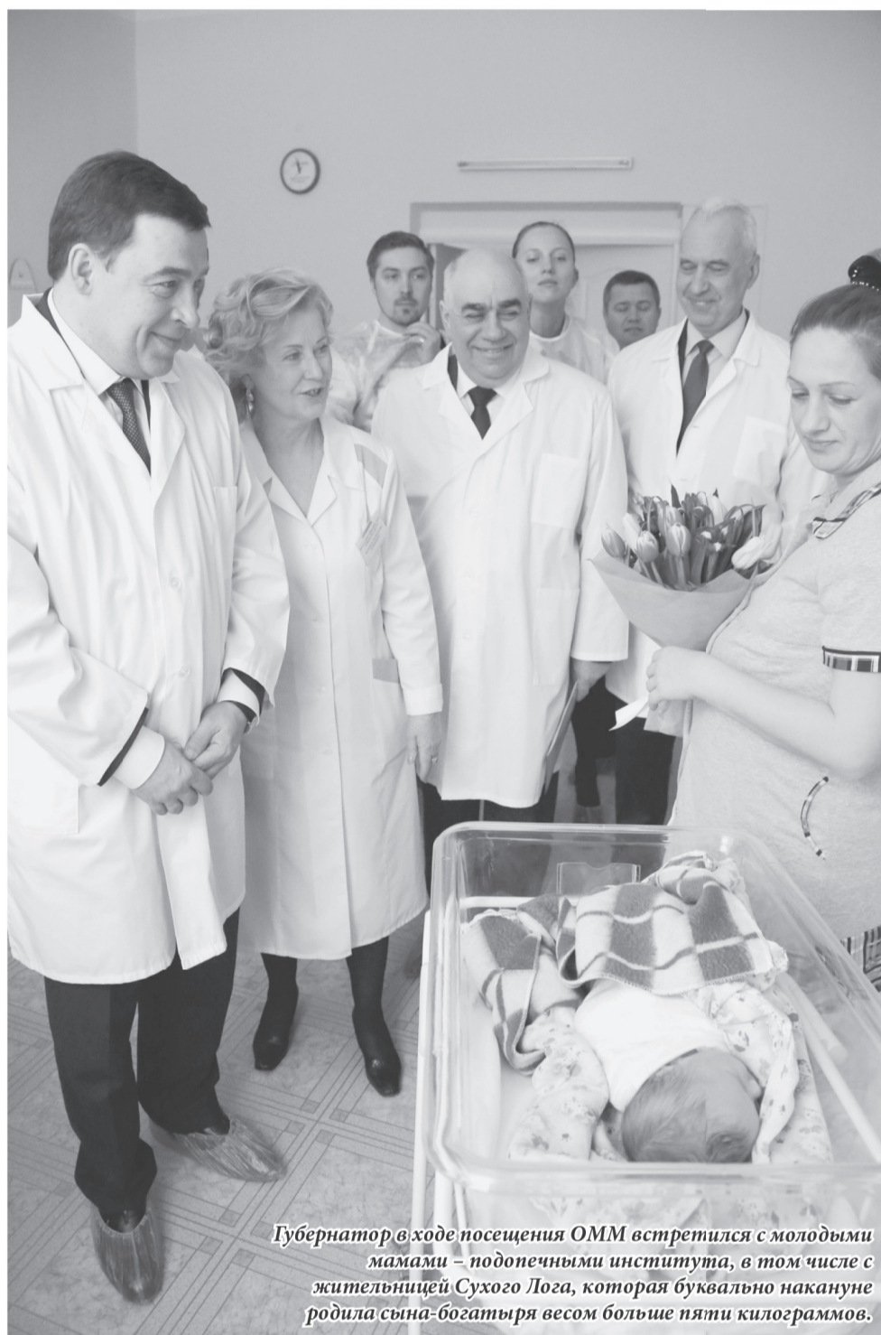
Губернатор в ходе посещения ОММ встретился с молодыми мамами – подопечными института, в том числе с жительницей Сухого Лога, которая буквально накануне родила сына-богатыря весом больше пяти килограммов.

Исправить ситуацию помогут передвижные мобильные комплексы, которые будут работать в территориях. Сейчас приобретены 5 таких автомобилей: в Первоуральске, Нижнем Тагиле, Ирбите, Каменске-Уральске и Краснотурьинске. В ближайшее время предстоит оснастить их необходимым оборудованием для оказания первичной помощи в мобильном варианте.