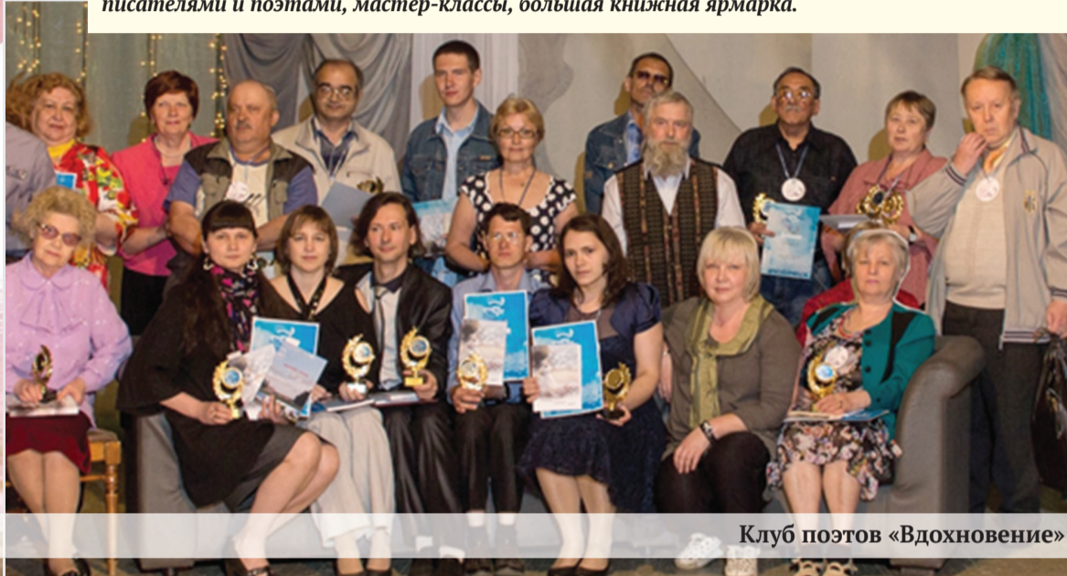
Клуб поэтов «Вдохновение»