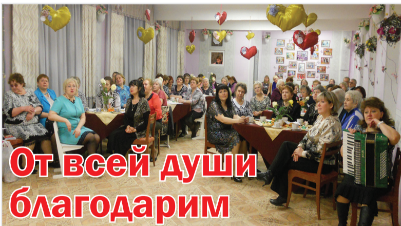
От всей души благодарим