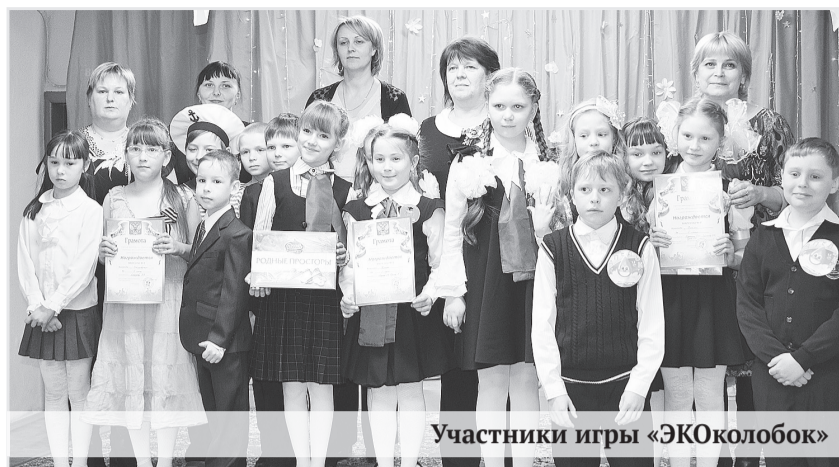
Участники игры «ЭКОколобок»

19 марта в ДЮЦ «Ровесник» состоялось театральное представление в рамках городской интеллектуальной игры «ЭКОколобок» для