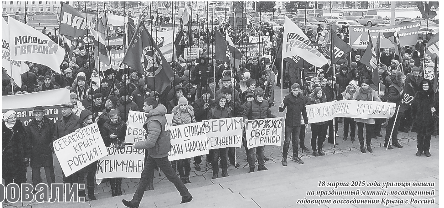
18 марта 2015 года уральцы вышли на праздничный митинг, посвященный годовщине воссоединения Крыма с Россией

Свердловская область за этот год активно шла к сотрудничеству с Республикой Крым. Как это было?