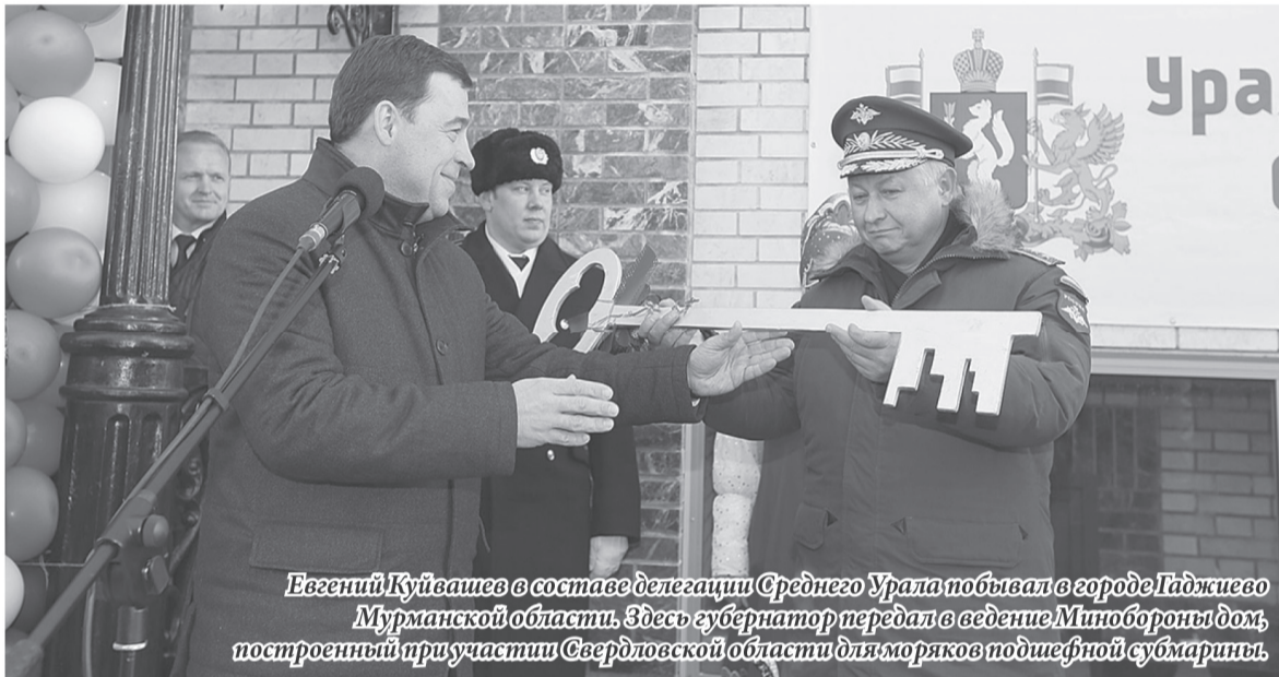
Евгений Куйвашев в составе делегации Среднего Урала побывал в городе Гаджиево Мурманской области. Здесь губернатор передал в ведение Минобороны дом, построенный при участии Свердловской области для моряков подшефной субмарины.