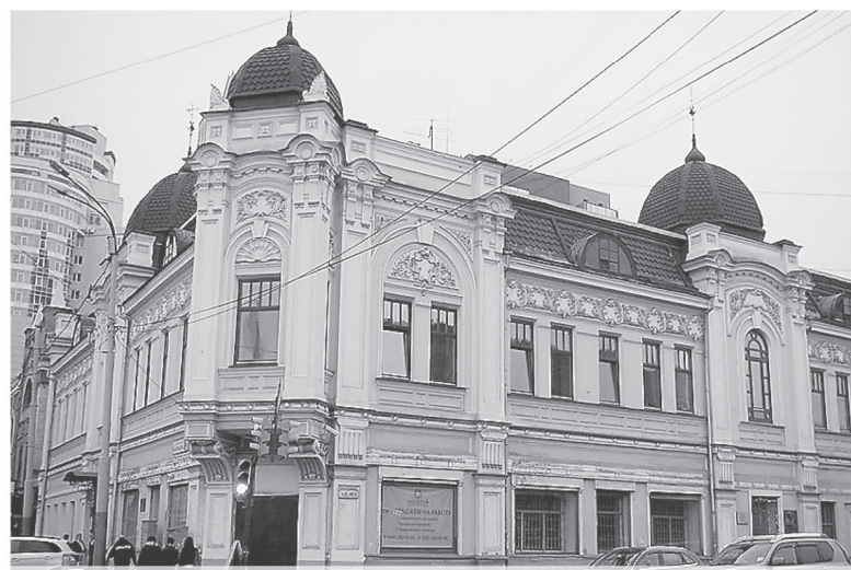
В Екатеринбурге это здание построено купцом Первушиным в начале XX века. В годы Великой Отечественной войны здесь работал прославленный радиодиктор Юрий Левитан. На здании установлена мемориальная доска.

залом и плавательным бассейном. На строительство ФОКа из регионального бюджета в 2014 году было выделено 50 миллионов рублей, в 2015 году – 67,4 миллиона рублей. В настоящее время решается вопрос о привлечении средств из федерального бюджета.