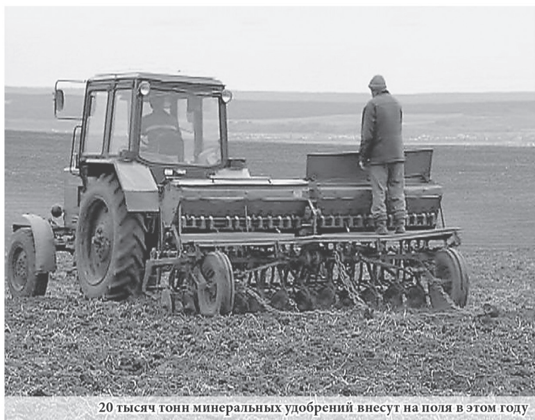
20 тысяч тонн минеральных удобрений внесут на поля в этом году

По последним данным министерства сельского хозяйства РФ, в южных районах страны посевная началась на 2 недели раньше. Мы не исключаем, что благодаря хорошей погоде и мы сможем выйти в поля раньше. А пока в рабочем порядке готовимся к кампании».