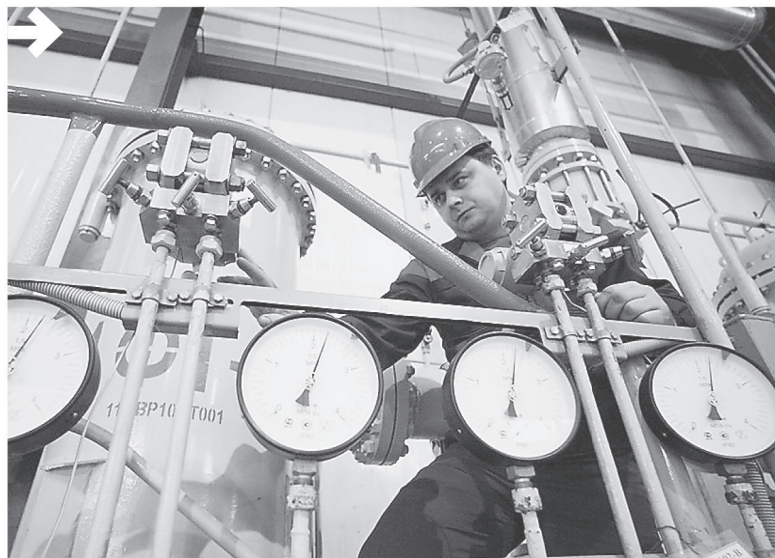
В сфере ЖКХ Свердловской области сейчас реализуются 75 инвестпроектов

«Наша стратегическая установка на мобилизацию экономического и общественного потенциала региона даёт свои результаты»