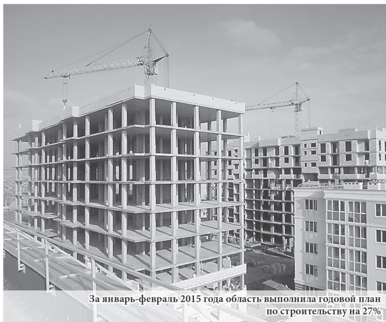
За январь-февраль 2015 года область выполнила годовой план по строительству на 27%

годового плана. Всего к концу года мы планируем построить 2,1 миллиона квадратных метров жилья. Но важно понимать, что сейчас сдаётся то, что начало возводиться в 2013 году – начале 2014 года. Поэтому сегодня мы должны делать задел на будущие периоды. Важно, чтобы застройщики не только работали над завершением имеющихся объектов, но и начинали новые проекты, которые будут сдаваться в 2016-2017 годах».